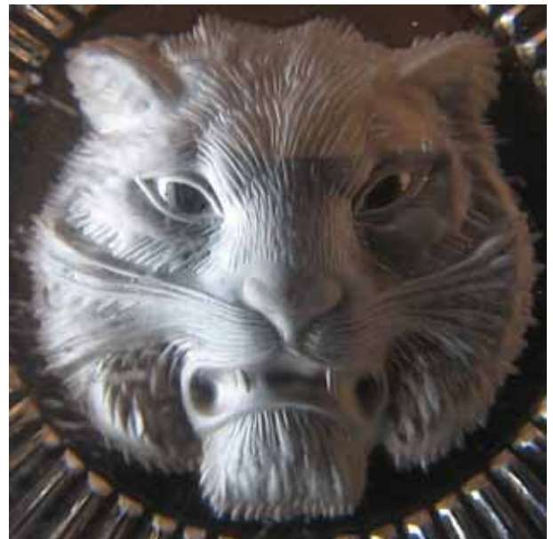
Abb. 2010-4/046 (Ausschnitt) Briefbeschwerer mit Katerkopf farbloses, gepresstes Bleikristallglas, H 4,5 cm, D 8,2 cm Sammlung Vogt PV-1502 s. MB Baccarat 1885, 2e. Partie, Planche 365, No. 4862A

schwerern, einer Massenware, der Körper aus Bleikristallglas gepresst wurde, die weit schwierigere und arbeitsaufwändigere Aushöhlung und Gravierung der Tierköpfe aber händisch gemacht wurde. Vor allem würde jedes Tier anders aussehen - die meisten Katzen würden schielen! Was ich mir gut vorstellen kann, ist dass man die in einem Arbeitsgang gepressten Gläser mit den Tierköpfen oft nachbearbeitet hat. Schon das wäre schwierig und teuer genug! Wahrscheinlich wurden die Köpfe nach dem Pressen mit Flusssäure mattiert, wie später bei den „negativen Reliefs“. Die Tierköpfe wurden sicher mit fein ziselierten, hochwertigen Stempeln gepresst. So konnte man mit einer Form und vielen Stempeln einen ganzen Zoo auf Briefbeschwerern verewigen. Und alle Bienen, Kater, Katzen, Hunde und ... würden gleich aussehen!