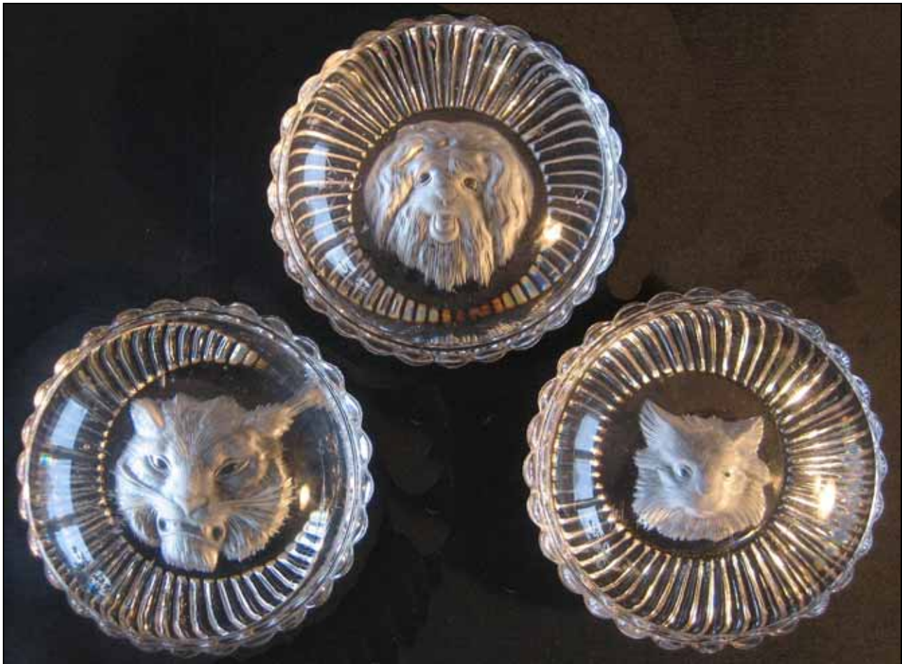
Abb. 2010-4/044 Briefbeschwerer großer Kater- und kleiner Katzenkopf sowie Hundekopf, farbloses, gepresstes Bleikristallglas, H 4,5 cm, D 8,2 cm Sammlung Vogt PV-1502, PV 1513, PV-1512 vgl. MB Baccarat 1885, 2e. Partie, Planche 365, No. 4862A SG: vgl.a. MB Baccarat 1893, Planche 58, Presse-papiers (Sujets dépolis), No. 4862A