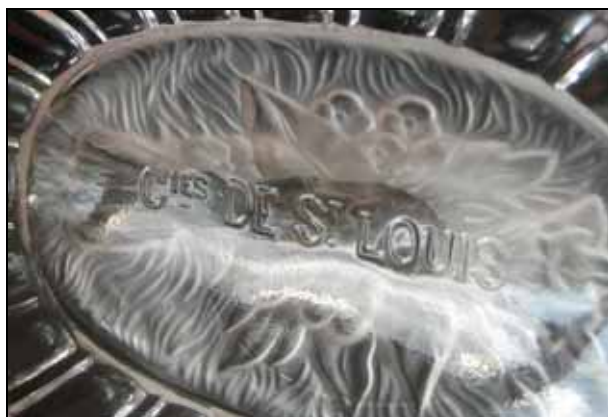
Abb. 2005-1-17/011 (Ausschnitt) → MB Saint Louis 1887, Planche 110, Sucrîers [Zuckerdosens] No. 1513, Sucrîer ovale, style Louis XVI et mascarons Sammlung Musée du Verre et du Cristal Meisenthal