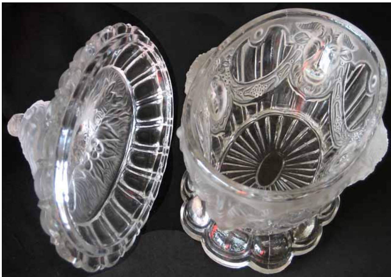
Abb. 2010-4/049 Deckeldose mit Masken, Vogel als Griff, farbloses Pressglas, mattiert, H mit Deckel 16,5 cm, B 9,5 cm, L 14,2 cm Sammlung Vogt, PV-1510 s. MB St. Louis 1887, Planche 110, No. 1513, Sucrîer ovale, style Louis XVI & mascarons, gemarkt „C ES DE S T . LOUIS“ vgl. MB Dyatkovo 1900, Tafel 176, Deckeldosen, Nr. 104