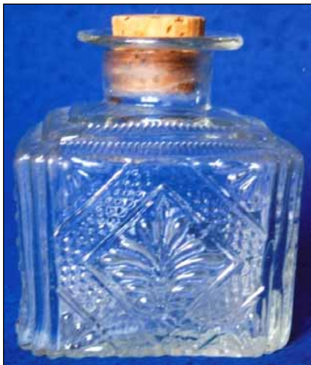
Abb. 2011-1/017 Flasche mit „Palmetten“-Muster als Teebehälter, Abriss farbloses, form-geblasenes Glas, H 11,5 cm, B 7,5 cm, L 10 cm Sammlung Stopfer Hersteller unbekannt, Steiermark oder Böhmen / Mähren um 1850

Abb. 2011-1/016 (Maßstab ca. 100 %) → Becher mit „Ranken“-Muster, Abrisspuren eines Hefteisens 2 vier-teilige „Blüten“ farbloses, form-geblasenes Glas, H 10,2 cm, D 7,4 cm Sammlung Stopfer Hersteller unbekannt, Steiermark oder Böhmen / Mähren um 1850 vgl. Adlerová 1972, Kat.Nr. 15, Abb.Nr. 10 wohl Georgenthal, Gratzen [Jiřikovo Údolı], 1860-1880