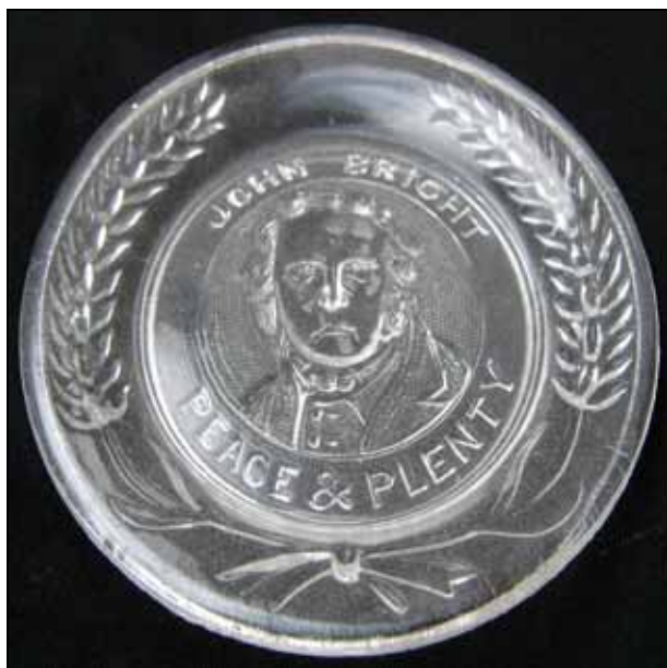
Abb. 2011-2/031 Erinnerungsteller John Bright farbloses Pressglas, D ca. 12,5 cm / 5 Zoll Sammlung Harris Molineaux & Webb, Manchester Flint Glass Works, um 1840