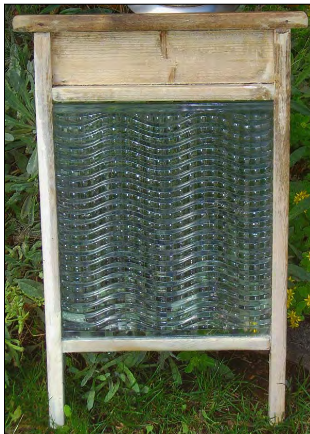
Abb. 2011-3/316 Waschbrett mit gläsernem Einsatz, Rahmen Buchenholz Holzrahmen H 55,5 cm, B 32 cm Glasscheibe H 32 cm, B 28 cm, gewelltes, kariertes Muster Hersteller unbekannt, Deutschland, 1930-er Jahre

Da das Waschen so aufwendig war, wuschen wohlhabendere Leute oft nur 2 bis 3 Mal im Jahr ; einfache Leute mussten oft einmal im Monat Waschtage abhalten, da sie nicht ausreichend Wäsche hatten. In den Städten gab es schon Washhäuser und Washküchen, in welchen mit warmem Wasser gewaschen werden konnte.