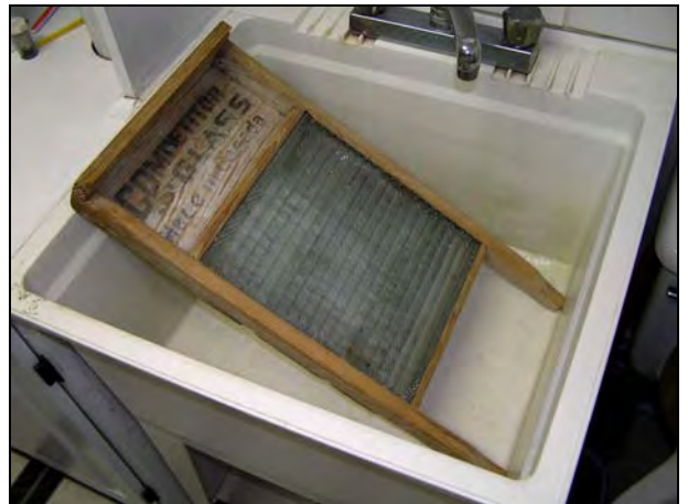
Abb. 2011-3/320 Waschbrett mit gläsernem Einsatz, Rahmen Buchenholz Inschrift „Competitor Glass Made in Canada“ Wikipedia DE ... Waschbrett: ... Glass washboard, early twentieth century, photo by Yannick Trottier 2005

Ein Waschbrett mit Glasscheibe kommt aus Australien :