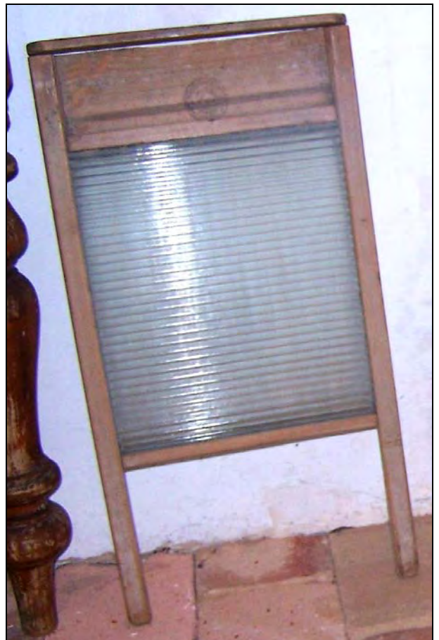
Abb. 2011-3/321 Waschbrett mit gläsernem Einsatz, Rahmen Buchenholz Inschrift nicht lesbar Wikipedia DE ... Waschbrett: ... Tranby House Washing boards, 2006, Gngarra, Australia

Ein Waschbrett mit Glasscheibe kommt aus Australien :