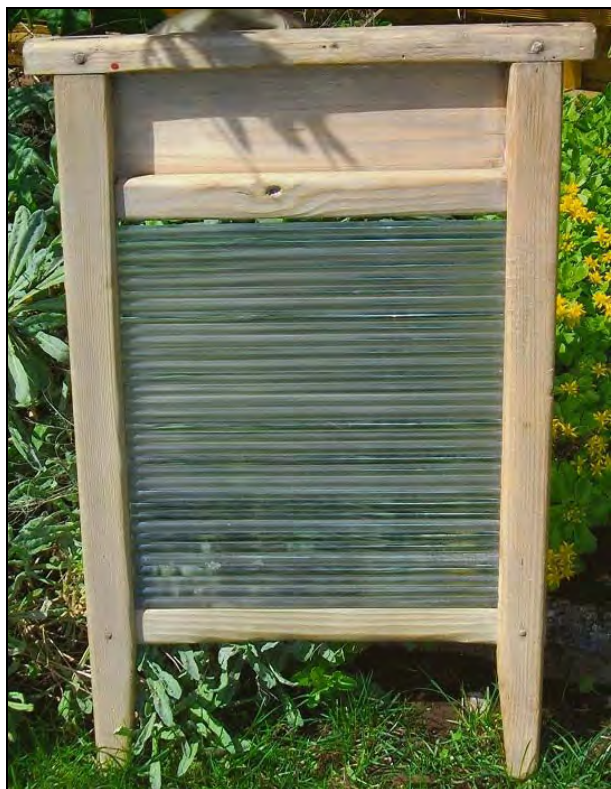
Abb. 2011-3/315 Waschbrett mit gläsernem Einsatz, Rahmen Buchenholz Holzrahmen H 58 cm, B 35 cm Glasfläche H 31 cm, B 28,5 cm wagrecht 33 bewegliche Glasstäbe, D 0,7 cm Sammlung Boschet Hersteller unbekannt, Deutschland, 1930-er Jahre