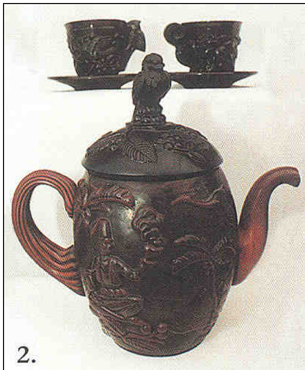
Abb. 2001-4/051 Teekanne und 2 Tassen (Entwurf Alexander Pfohl) aus GCD 10/05-1997, S. 88, Auktion Sotheby, What is it? opak-dunkelrotes Pressglas (soweit auf der Abb. erkennbar) Heinrich Hoffmann, Gablonz, um 1938