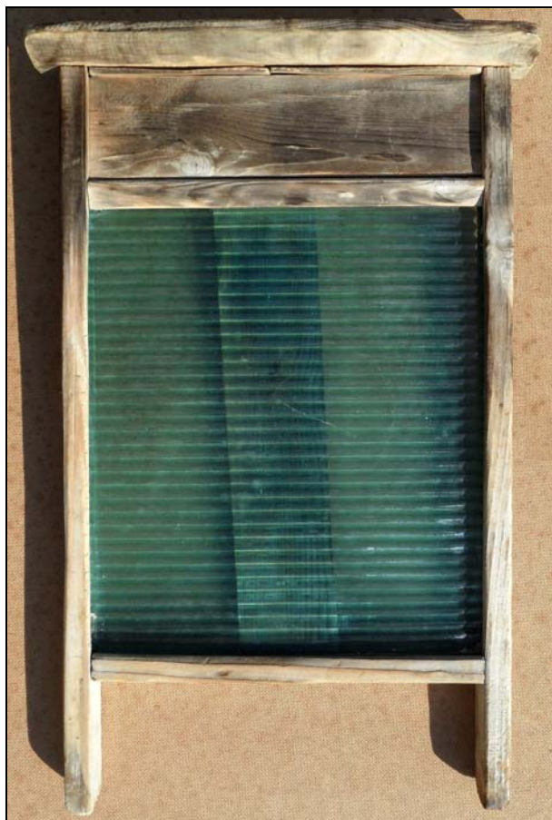
Abb. 2011-4/251 Waschbrett mit gläsernem Einsatz, Rahmen Fichtenholz Holzrahmen H xxx cm, B xxx cm Sammlung Mattes ohne Marke Hersteller unbekannt, Deutschland, 1930-er Jahre vgl. PK 2011-3, Sammlung Boschet und Sammlung Peltonen