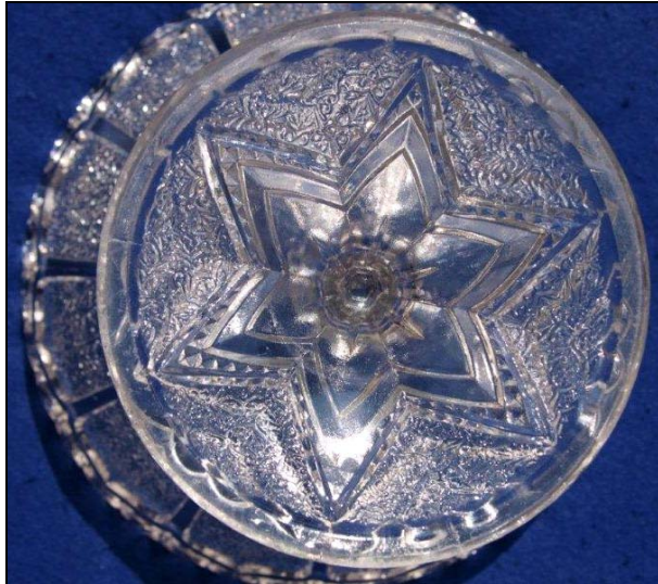
Abb. 2011-4/032 Tafelaufsatz, Pseudo-Schliffmuster, in den 12 Feldern unregelmäßige Struktur, farbloses Pressglas, H 21,2 cm, D 22 cm Sammlung Stopfer Hersteller unbekannt, Rautenmarke - Henry Greener, Sunderland, Reg.Nr. 284695 vom 27. August 1874 - Persival, Vickers & Co. Ltd., Manchester, Reg.Nr. 352870 vom 27. Juli 1880

Abb. 2011-4/031 → Tafelaufsatz, Pseudo-Schliffmuster weiß-opalisierendes Pressglas, rosa Rand, H 11 cm, D 18 cm Sammlung Stopfer Hersteller unbekannt, England?, um 1890?