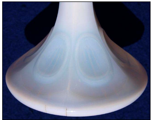
Abb. 2011-3/013 Fußschale / Tafelaufsatz „Richelieu“ farbloses Pressglas, H 21,0 cm, D 27,0 cm, G ca. 2,0 kg Sammlung Vogt PV-1597 George Davidson & Co., Gateshead, R D 96945, 31. März 1888