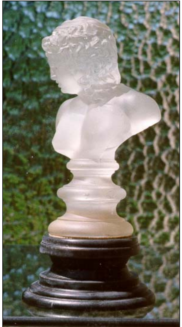
Abb. 1999-5/061 Büste „Adonis“ nach Canova, auf einem Sockel farbloses Glas, gepresst, säure-mattiert, H Büste 14 cm Sockel aus schwarzem Glas geblasen, H mit Sockel 18 cm Sammlung Roese Hersteller vielleicht Riedel, Polaun, um 1880 vgl. Riedel 1994, S. 133, Abb. 250

Nach Baumgärtner 1981 sind diese Figuren bereits um 1880 entstanden. Leider konnte keine dieser Figuren bisher in einem MB Riedel gefunden werden. An den Zuschreibungen von Baumgärtner 1981 und MSB Jablonec 1991 habe ich keinen Zweifel. Das Musterbuch werden wir auch noch finden!