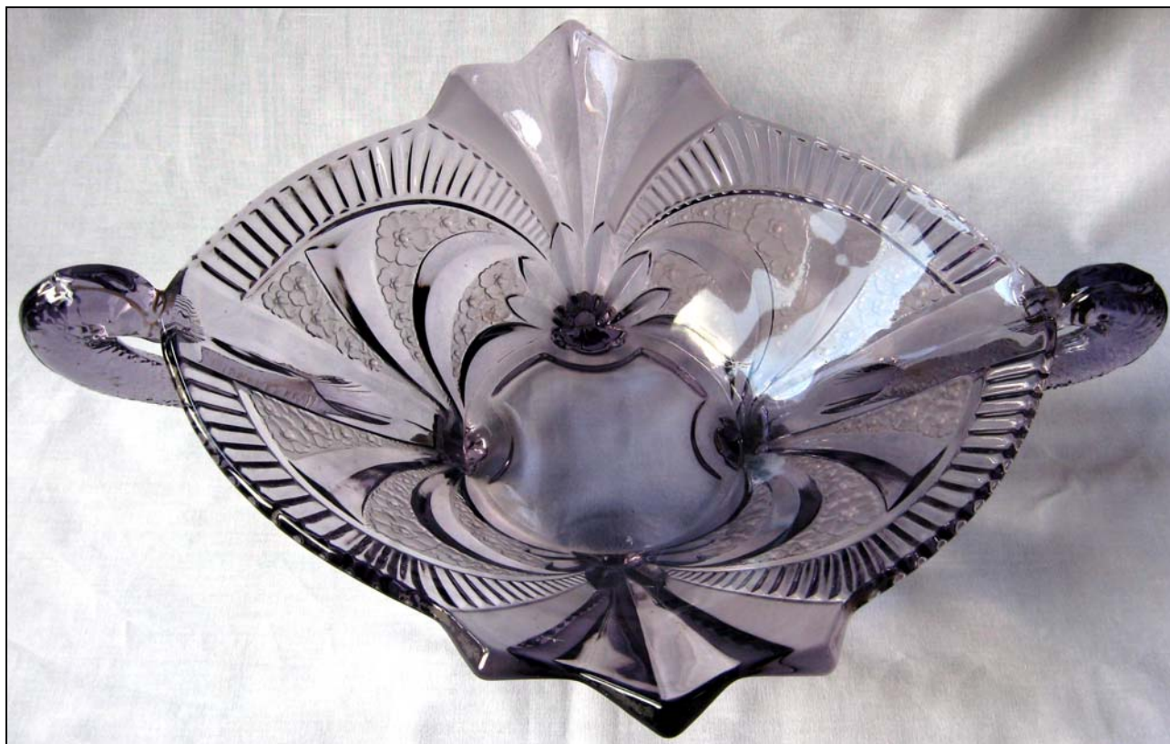
Abb. 2012-1/16-03 Fruchtschale mit Fischhenkeln, violette Pressglas, teilweise mattiert, H 12 cm, B 34 cm, L 43 cm Sammlung Michl s. MB Brockwitz 1941, Tafel 76, Nr. 9076a/27 und Nr. 9076a/33, im Boden außen mit Stempel eingeztzt „DEUTSCHLAND“