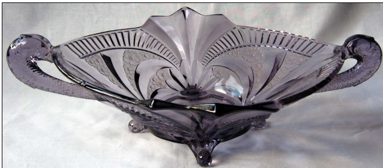
Abb. 2012-1/16-01 Fruchtschale mit Fischhenkeln, violetteres Pressglas, teilweise mattiert, H 12 cm, B 34 cm, L 43 cm Sammlung Michl s. MB Brockwitz 1941, Tafel 76, Nr. 9076a/27 und Nr. 9076a/33, im Boden außen mit Stempel eingeztzt „DEUTSCHLAND“