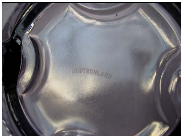
Abb. 2012-1/16-02 Fruchtschale mit Fischhenkeln violetteres Pressglas, teilw. mattiert, H 12 cm, B 34 cm, L 43 cm im Boden außen mit Stempel eingeztzt „DEUTSCHLAND“ Sammlung Michl s. MB Brockwitz 1941, Tafel 76, Nr. 9076a/27 und Nr. 9076a/33

SG: In MB Brockwitz 1941 wurden keine Farben angegeben. Wahrscheinlich wurde die Glasfarbe „Amethyst“ verwendet, die in den 1930-Jahren Mode wurde.