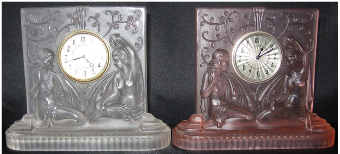
Abb. 2012-1/27-01 Relief-Uhren mit zwei Frauenakten und Blütenranken farbloses und rosalin-farbenes Pressglas, mattiert, Sockel B 6 cm, L 20,7 cm, H 17 cm Sammlung Michl s. MB Walther 1934, Tafel 73, Tafelschmuck, Nr. 44043 Uhrgehäuse