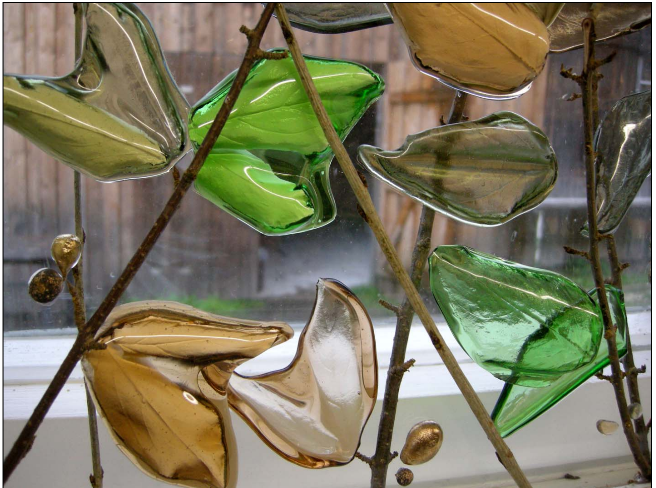
Abb. 2012-2/55-01 Nicola Ransom, heiß geformtes Flachglas