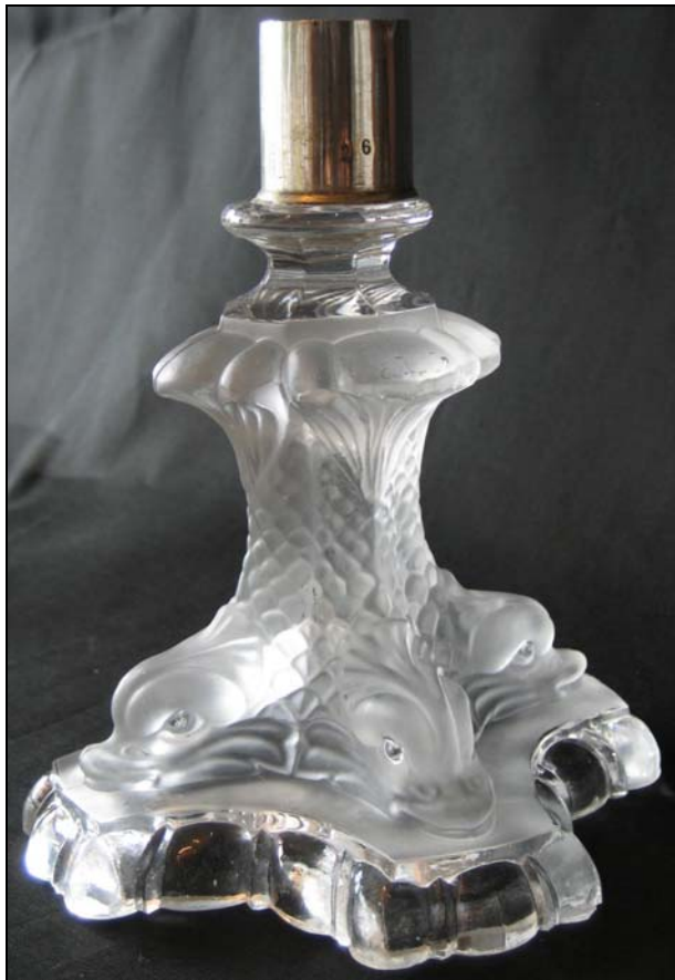
Abb. 2012-2/20-11 Leuchter mit 4 Delphinen aus gepresstem Bleikristallglas, teilweise mattiert H x B x L 12,5 x 9,7 x 9,7 cm, Gewicht 470g Sammlung Vogt PV-296' Marke „S T . LOUIS DÉPOSÉ“ St. Louis, letztes Viertel 19. Jhd. (wegen der Marke) vgl. MB St. Louis 1904, Planche 107, No. 1782

Bekannt bei Sammlern von französischem Pressglas, z.B. von Baccarat oder St. Louis, sind besonders die eingepressten Marken „ S T . LOUIS DÉPOSÉ “, „ CHOISY-LE-ROI DÉPOSÉ “ und „ SÈVRES DÉPOSÉ “. Die Cristallerie de Saint-Louis lag ab 1871 im deutsch annektierten Bereich von Lothringen im Ort Münzthal, galt also im Deutschen Reich als