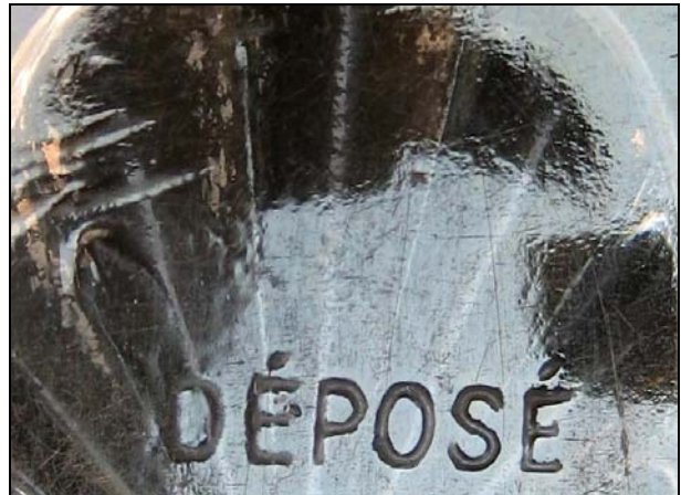
Abb. 2010-1/048 Senftopf mit „Neo-Rokoko“-Muster farbloses Pressglas, H 10,6 cm, D 6,8 cm Sammlung Vogt PV-597 eingepresste Marke „SÈVRES DÉPOSÉ“ Cristalleries de Sèvres (et Clichy réunies?), um 1870-1890?