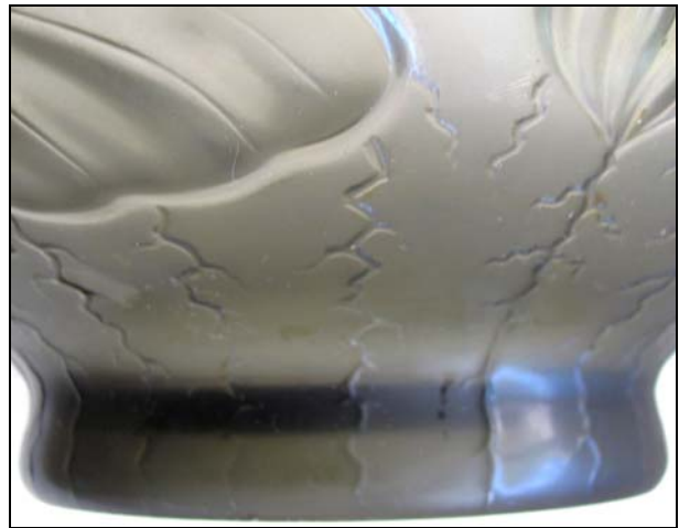
Abb. 2012-3/56-04 Schale mit Seerosenblüten- und blättern, rauch-farbenes Pressglas, außen mattiert, H 11,5 cm, D 28,5 cm Sammlung Kuban vgl. MB Inwald 1934, Tafel 155, 156, 157, Vasen, Serie „Barolac“ vgl. MB Glassexport „Barolac“ 1949/1952, Vase Nr. 11281/A 9 ¼“, B 8 ½“, C 11“