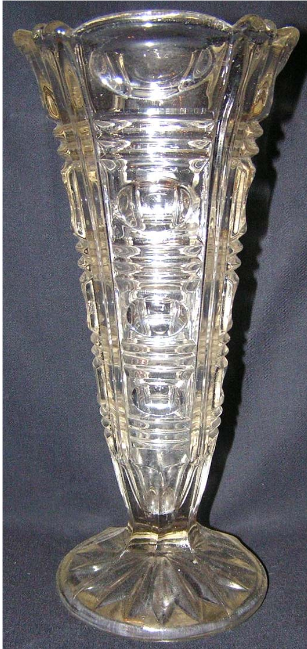
Abb. 2012-3/37-04 Vase „Richard“ mit Pseudoschliff-Muster farbloses Pressglas, H 21 cm, D 11,8 cm, Fuß D 9,2 cm Sammlung Rühl & Sadler Walther / Sachsglas, vor 1939, s. MB VEB Sachsglas 1961, Nachtrag Vasen , Tafel o.Nr., Nr. 51.861 & Nr. 51.862