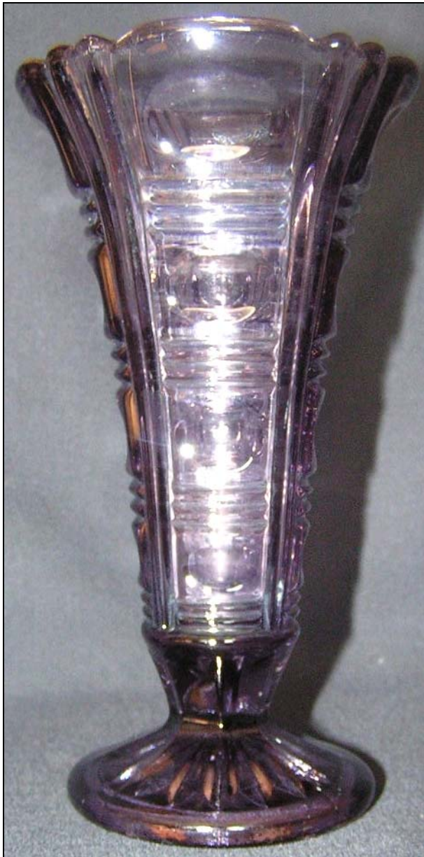
Abb. 2012-3/37-06 Vase „Richard“ mit Pseudoschliff-Muster violette Pressglas, H 16 cm, D 8,8 cm, Fuß D 7,2 cm Sammlung Rühl & Sadler Walther / Sachsglas, vor 1939, s. MB VEB Sachsglas 1961, Nachtrag Vasen , Tafel o.Nr., Nr. 51.861 & Nr. 51.862