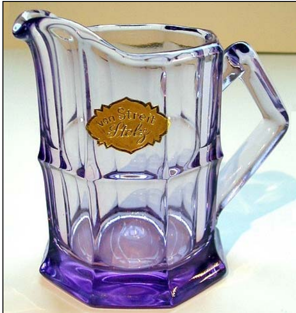
Abb. 2012-3/59-01 Kännchen, lila-amethyst-farbenes Pressglas, H 9 cm, D 6 cm, Gebrüder von Streit, Hosena-Hohenbocka, um 1935 Etikett „von Streit Stolz“

Sehr schönes, antikes Kännchen (Sahne, Soßen ...) aus edlem, schweren Pressglas der Marke von Streit Stolz . Sehr selten in dieser wunderschönen Farbe und Form und vor allem in diesem exzellenten Zustand. Es scheint wie neu und unbenutzt, was man auch an der goldenen Marke sehen kann, die beim Spülen gelitten hätte. Am Boden ist keine Pressnaht , und auch die einzige Pressnaht, die am Henkel und vorne verläuft ist quasi unsichtbar. Größe: Höhe 9 cm, Durchmesser oben: 6 cm