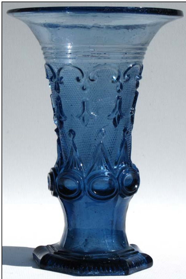
Abb. 2012-3/12-01 Jasminvase mit Oliven, Ranken und Sablée, blaues, form-geblasenes Glas, H 14,5 cm, D Rand 10,2 cm Fuß acht-eckig, Abriss, D Fuß 6,6 bzw. diag. 7,2 cm Sammlung SG 2012 Hersteller unbekannt, Frankreich?, um 1830?

Die Jasminvase wurde in einer Form fest geblasen, alle Details sind scharf ausgebildet und nicht verschwommen durch Feuerpolieren. Der Rand wurde weit aufgetrieben und ist eben. Es wurden keine Blasen mit aufgetrieben und keine Kohlestückchen eingerieben. Der acht-eckige Fuß wurde auf der Unterseite nach dem Form-blasen nicht bearbeitet, der Abriss in der Mitte wurde nicht ausgeschliffen, am Rand innen ist eine Absplinterung, die wahrscheinlich bereits beim Lösen