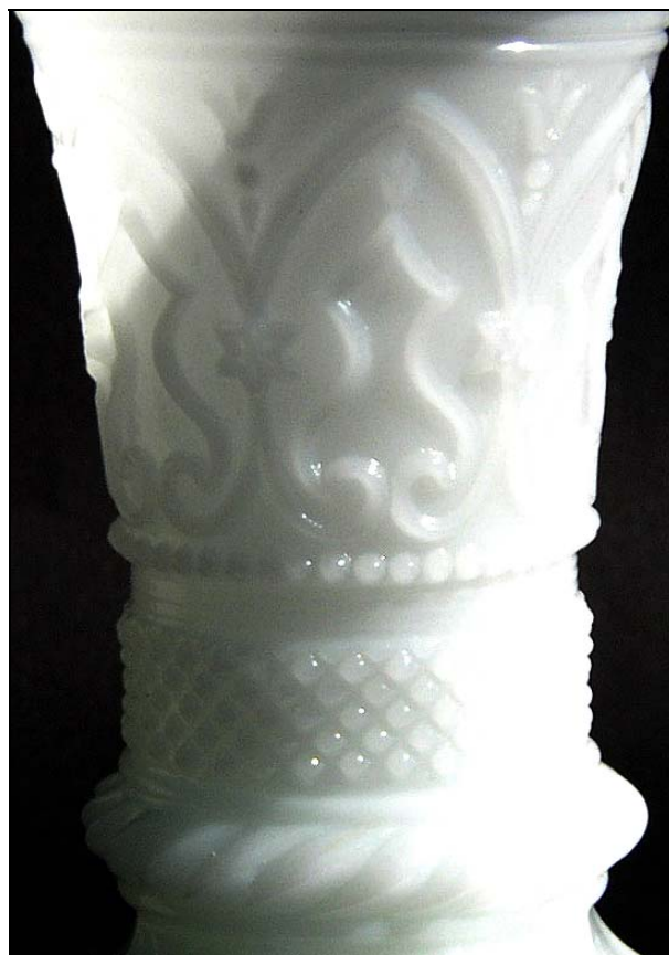
Abb. 2013-1/08-02 Jasminvase mit Spitzbögen und Diamanten-Band, Grund Sablée, 8-eckiger Fuß, über dem Fuß spiralig verdrehtes Band Boden und Abriss roh belassen, form-geblasenes Glas opak-weißes Glas, blaugrauer Stich, schwach durchscheinend, H 19,7 cm, D 15,3 cm Wand, Muster und Formnähte stark verdreht, aufgetriebener Rand innen mit eingeriebenen Narben Sammlung SG 2013 Hersteller unbekannt, Frankreich, um 1850-1870?