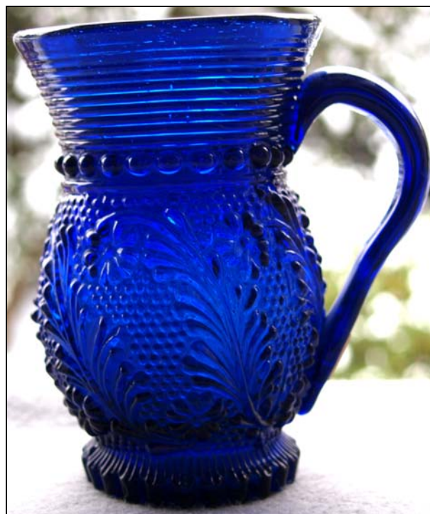
Abb. 2013-1/53-03 Henkelkrüglein mit abstraktem Motiv, wagrechten Linien, Perlenreihen, Boden strahlig gekerbt, Henkel unten angesetzt, Grund Sablée, 3 Formnähte, Abriss, form-geblasenes Glas, blau H 12 cm, braun H 12,5 cm, farblos H 13,4 cm Sammlung Stopfer wohl Steiermark, um oder nach 1900

Abb. 2013-1/53-02 Henkelkrüglein mit Pflanzendekor und 6 Blumen, wagrechten Linien, Perlenreihen, Bodenrosette, Henkel oben angesetzt, Grund Sablée, 3 Formnähte, Abriss kobalt-blaues form-geblasenes Glas, H 11 cm Sammlung Stopfer s.a. Abb. 2007-3/077, Sechs form-geblasene Kännchen der Sammlung Lenek, Böhmen / Steiermark?, um 1850 wohl Steiermark, um 1850 www.pressglas-korrespondenz.de/aktuelles/pdf/pk-2007-3w-lenek-kaennchen-form-geblasen.pdf