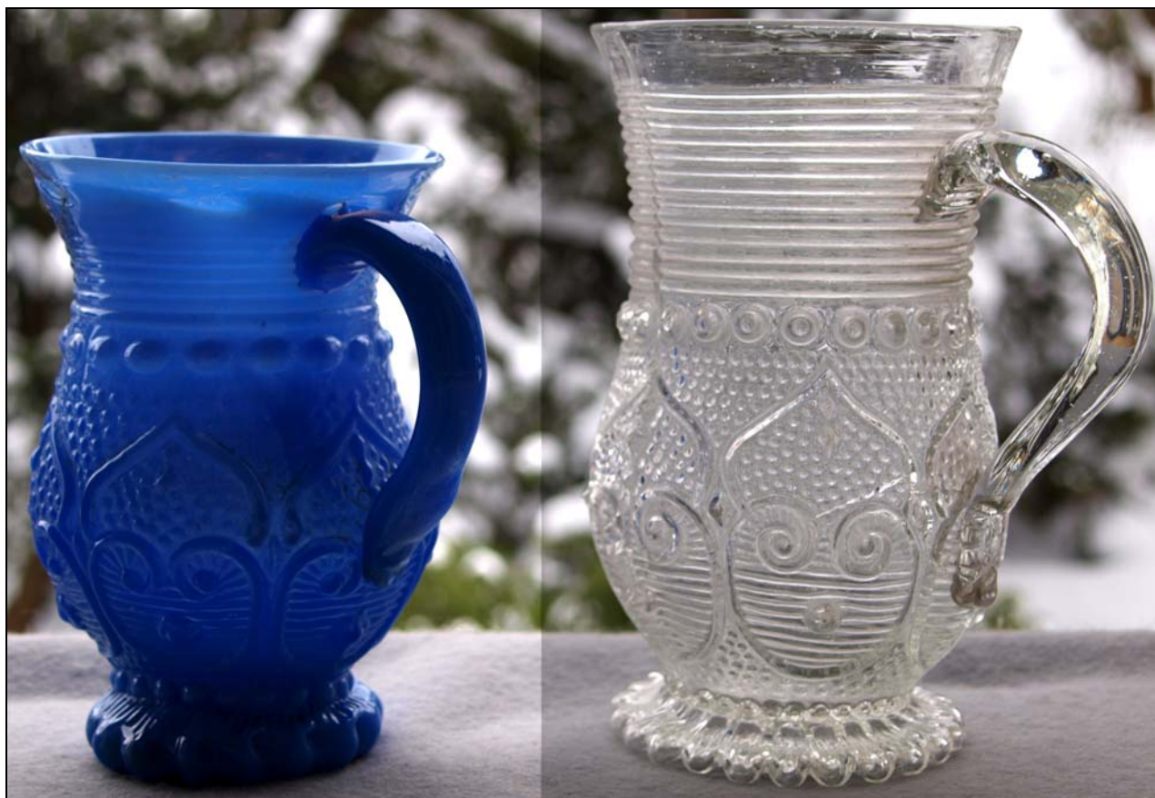
Abb. 2013-1/53-01 Henkelkrüglein mit abstraktem Motiv, wagrechten Linien, Perlenreihen, Boden strahlig gekerbt, Henkel oben angesetzt, Grund Sablée 3 Formnähte, Abriss, opak-hellblaues form-geblasenes Glas, H 12 cm, farbloses form-geblasenes Glas, H 13,8 cm Sammlung Stopfer wohl Steiermark, um 1850