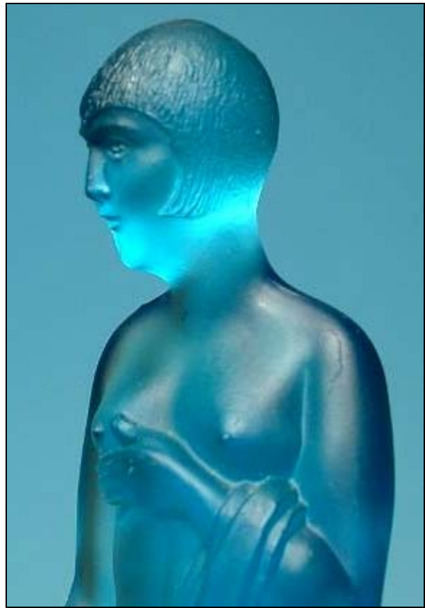
Abb. 2013-2/54-04 Halbnackte Dame mit Bubikopf, farbloses und rosalin-farbenes Pressglas, fein mattiert, H 18 + 20 cm Sockel Figur D 6,5 cm leicht konisch, Sockel Block Boden D 14,3 cm Sammlung Gerlach links unmarkiert, rechts Basis der Figur markiert "REGISTERED 749772 FOREIGN" Glashüttenwerk „Germania“, Schweig, Müller & Co., Weißwasser O.L., um 1930