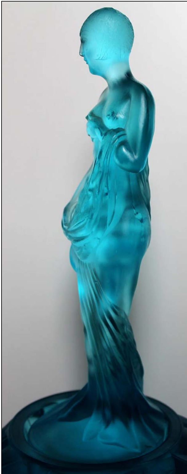
Abb. 2013-2/54-02 Halbnackte Dame mit Bubikopf auf Eisblock als Lampe blaues Pressglas, fein mattiert, H 18 + 20 cm Sockel Figur D 6,5 cm, Sockel Block Boden D 14,3 cm Sammlung Gerlach Basis der Figur markiert "REGISTERED 749772 FOREIGN" Glashüttenwerk „Germania“, Schweig, Müller & Co., Weißwasser O.L., um 1930