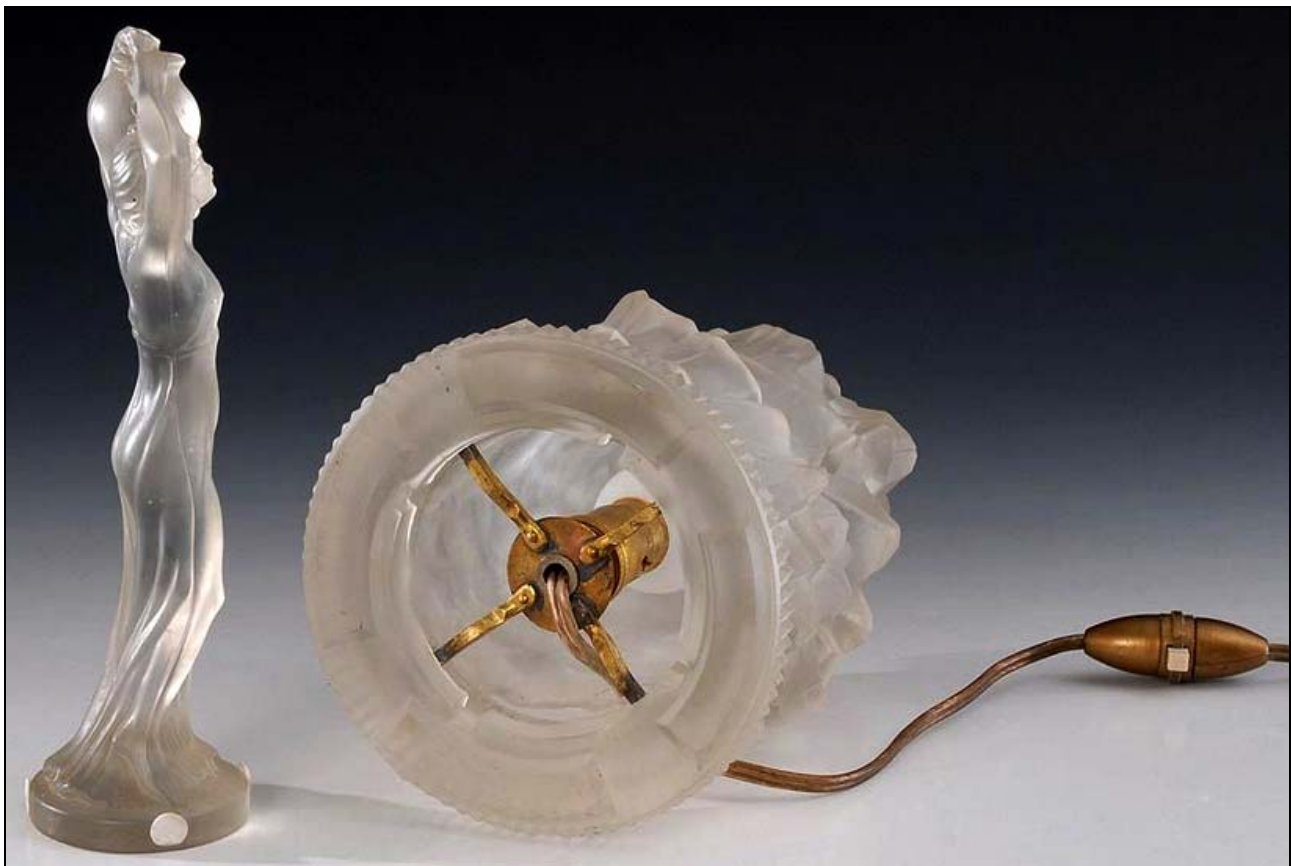
Abb. 2009-4-03/007, MB Glassexport Libochovice 1934/1949, Tafel 3, Schalen, Tafel 4, Figuren, Schalen