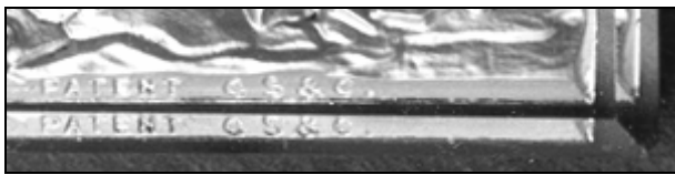
Abb. 2006-4/082 und Abb. 2006-4/083 Briefbeschwerer „Leute auf einem Boot im Schilf“ farbloses Pressglas, H 1,9 cm, B 7,4 cm, L 12,7 cm Sammlung Stopfer eingepresste Marke „GS. & C o PATENT“ Gebrüder Siegwart & Co., Stolberg bei Aachen, um 1875