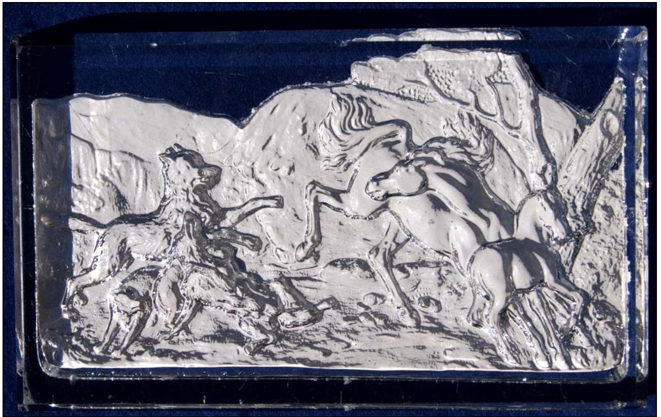
Abb. 2013-2/14-01 Briefbeschwerer wildernde Hunde (Wölfe ?) und scheuende Pferde, farbloses Pressglas, L 13,5 cm, B 8,3 cm und H 1,8 cm eingepresste Marke „GS&CO“, Gebrüder Siegwart & Co., Stolberg, um 1875