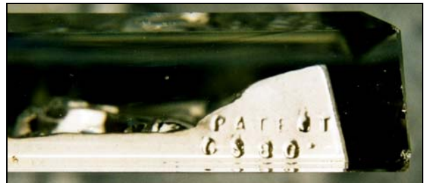
PK 2008-2, S. 142 Paperweight „Löwenjagd“ aus Schramek, „Lobmeyr“ Paperweights Explored, PCA Bulletin 2002, Abb. 1 „Lobmeyr“ Paperweight Sammlung Bergstrom-Mahler Museum 5 5/8" x 3 3/8" x 3/4" [14,3 x 8,6 x 1,9 cm]