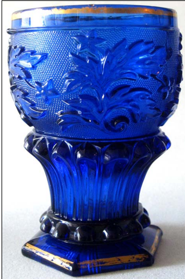
Abb. 2013-2/35-01 Fußbecher mit Blumenmuster kobalt-blaues Pressglas, Rand vergoldet, H 11,6 cm, D 8,3 cm Sammlung Vogt s. MB Launay, Hautin & Cie., um 1840, Planche 68, No. 2193 S.L. (2), „Gobelet ballon m. bambous à fleurs“ St. Louis, um 1840