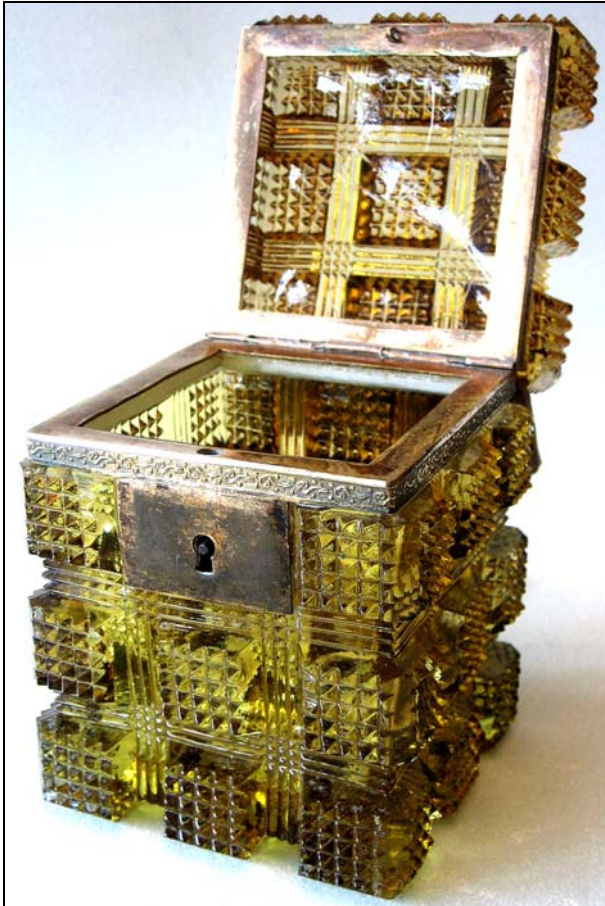
Abb. 2013-2/35-02 Schatulle mit Diamanten-Gitter und Metallmontierung bernstein-farbenes Pressglas, H 12 cm, B 9 x 9 cm Sammlung Vogt vielleicht St. Louis, um 1865

Die bernstein-farbene Schatulle wurde vermutlich auch in Saint Louis hergestellt. In den mir bekannten Katalogen konnte ich diese Schatulle nicht finden. Die Schatulle ist sehr schwer und wiegt 1225 g. Die Maße L 9 cm, B 9 cm, H 12 cm.