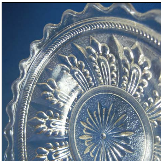
← Abb. 2013-3/14-02 Schale mit Blätter-Muster, Rand mit Schnur und Bögen, Bodenring, Bodenstern, Grund unregelmäßig gekörnt, H xxx cm, D xxx cm Sammlung Reith s. MB Ehrenfeld 1886, Tafel 57, Gepresstes Service „Irene“, Nr. 1231