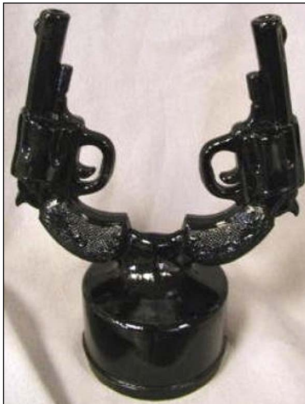
Abb. 2013-3/09-06 Revolver mit Griffschalen, Pressglas Hersteller unbekannt, USA, um 1890?

Möglicherweise wurden diese Waffen ursprünglich in den Jahren 1900 bis 1920 gemacht und dann nochmals 1950 bis 1960 und wieder irgendwann nach 1970 ? Wie die 4 Varianten zu diesen Zeiträumen zugeordnet werden soll, ist mir unklar. Vielleicht kann uns das jemand vom “National Westmoreland Glass Collectors Club“ ( westmorelandglassclub.org ) eines Tages erklären. Laut einer Aussage soll die Ursprungsform von 1932 stammen. Der Revolver ist bei eBay für $ 9,99 verkauft geworden. Gleichzeitig verlangt ein Verkäufer $ 1,595 immer noch in einem eBay Shop!