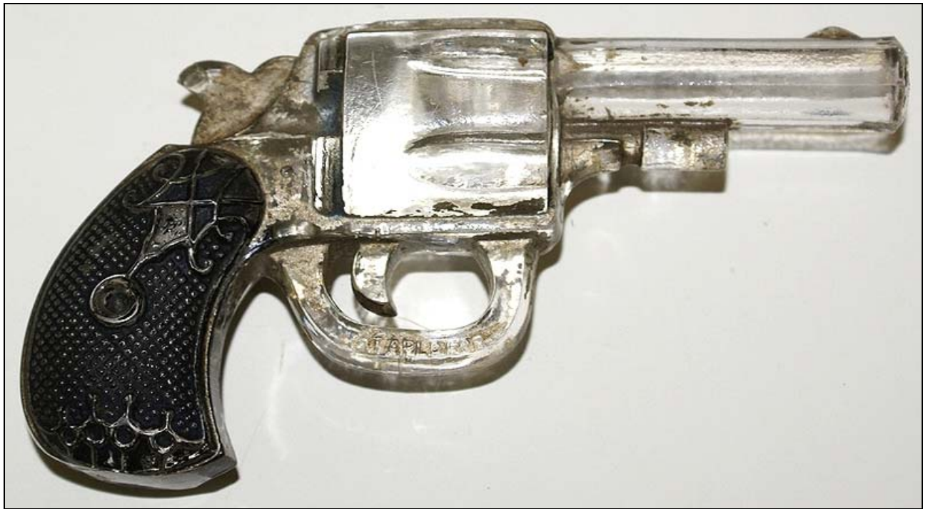
Abb. 2013-3/09-01 (Maßstab ca. 130 %) Revolver mit schwarz bemalten Griffschalen, farbloses Pressglas, L 12,7 cm, Hersteller unbekannt, USA, um 1890? eBay USA Art.Nr. 330968185166, 2013-08-05