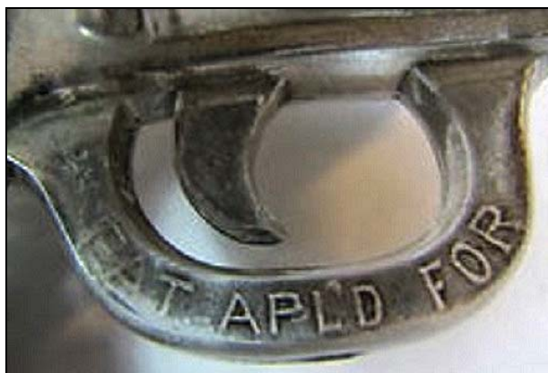
Abb. 2013-3/09-05a & Abb. 2013-3/09-05b Revolver mit schwarz bemalten Griffschalen farbloses Pressglas, L 12,7 cm eingepresste Inschrift „PAT APLD FOR“ Hersteller unbekannt, USA, um 1890? Sammlung Peltonen

Auf einem Flohmarkt bei unserem PK-Treffen in Dänemark 2010 habe ich einen ähnlichen Glasrevolver erworben wie im obigen Artikel beschrieben wurde (Abb. 2013-3/09-04). Mein Revolver hat schwarze Farbe an den Seiten des Griiffs. Die Kammermündungen der Trommel sind auch schwarz bemalt. Der Rest ist mit einer silber-artigen metallischen Farbe bedeckt (Abb. 2013-3/09-13). Laut verschiedenen Internet-Quellen handelt es sich um eine Form, die ursprünglich aus der Westmoreland Glass Company kam. Auf dem Markt gibt es mindestens vier Variationen . Auf der rechten Seite des Abzugsbügels meines Revolvers ist eine Inschrift “PAT APLD FOR“ eingepresst (Abb. 2013-3/09-14). Eine andere Variante hat den gleichen Text, aber in der Form “PAT. APL'D FOR“ wobei der Text auch breiter ist (Abb. 2013-3/09-05). Die dritte Variante ist ganz ohne diese Schrift .