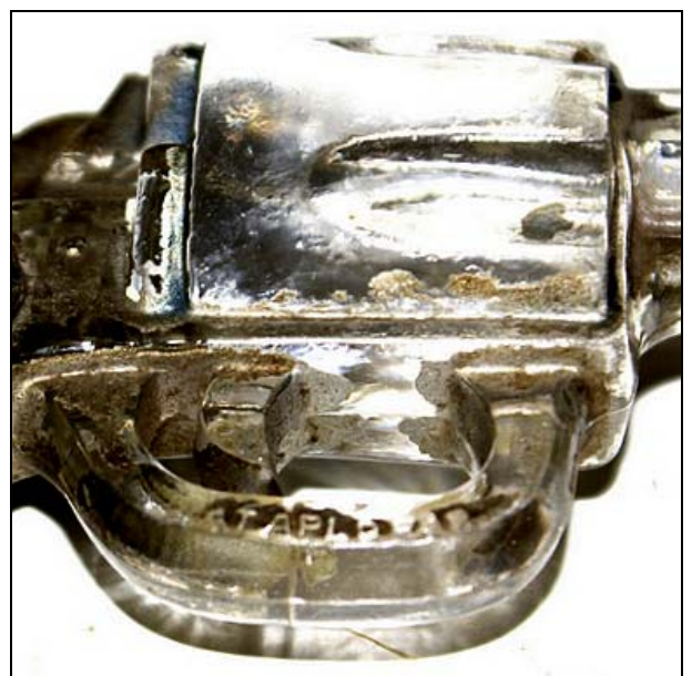
Abb. 2013-3/09-02 Revolver mit Griffschalen, farbloses Pressglas, L 12,7 cm, Hersteller unbekannt, USA, um 1890? eBay USA Art.Nr. 330968185166, 2013-08-05

Der Hersteller ist unbekannt, mehrere Paperweights, die Gegenstände abbilden, sind eher in die Jahrzehnte vor 1900 zu datieren.