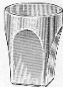
Saar No. 120