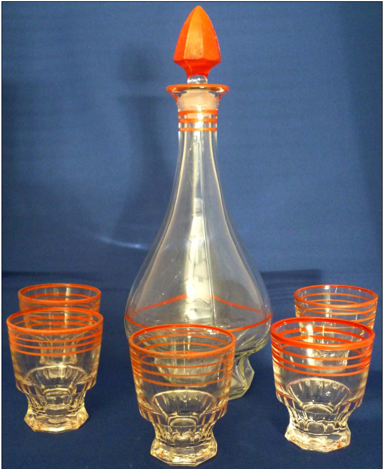
Abb. 2013-3/24-01 Karaffe mit 5 Bechern, farbloses Pressglas, bemalt mit hellroten Linien, H 24 cm, D 10,8 cm, Becher H 6,1 cm, D 5,3 cm Sammlung Glasmuseum Warndt, Ludweiler, s. MB Saarglas-AG Fenne-Saar, um 1935