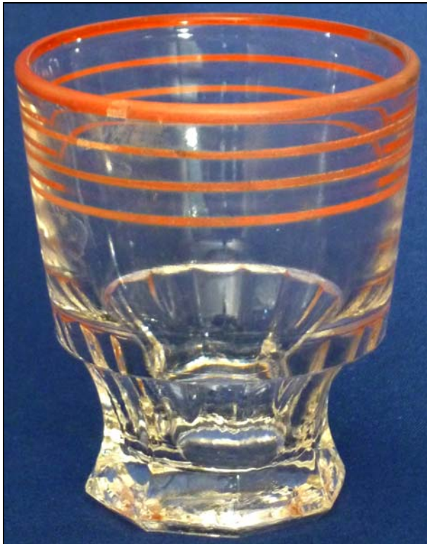
Abb. 2013-3/24-02 und Abb. 2013-3/24-03 Karaffe mit 5 Bechern, farbloses Pressglas, bemalt mit hellroten Linien, H 24 cm, D 10,8 cm, Becher H 6,1 cm, D 5,3 cm Sammlung Glasmuseum Warndt, Ludweiler s. MB Saarglas-AG Fenne-Saar, um 1935

SG: Auf dem Titelblatt des MB Saarglas-AG Fenne-Saar, wird kein Datum angegeben. Dazu Nest: