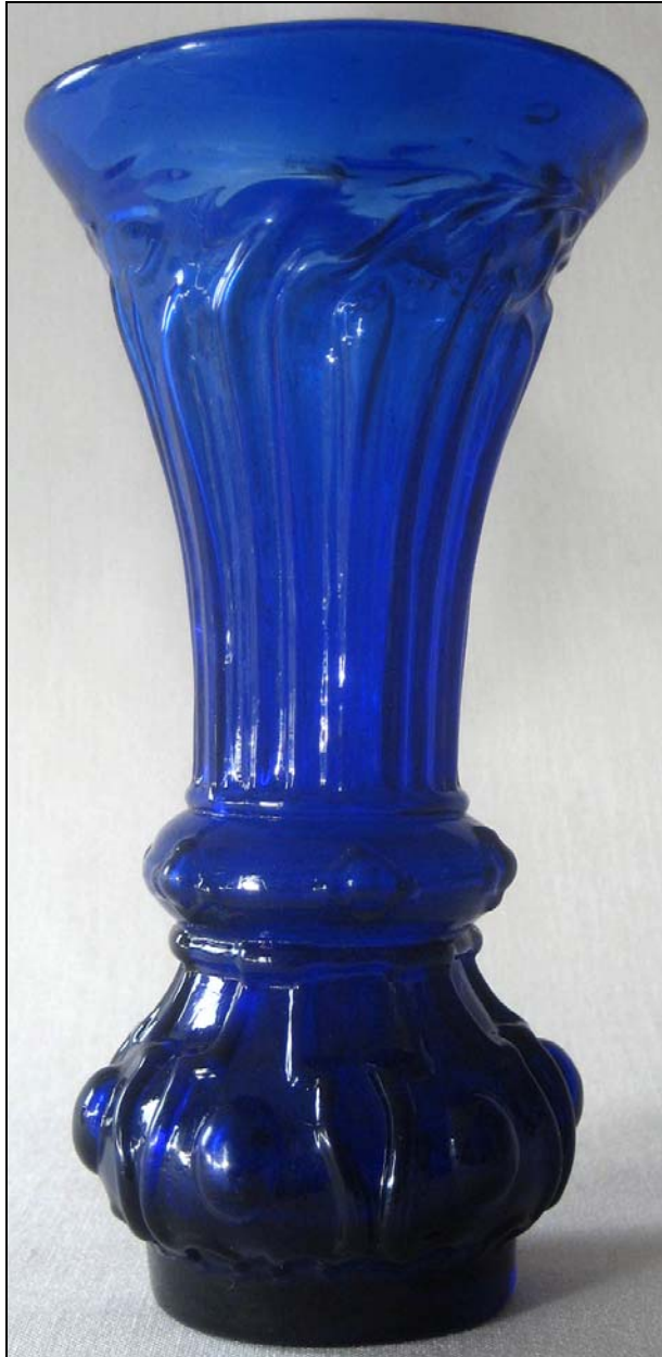
Abb. 2013-4/27-04 Vase mit Rippen kobalt-blaues form-geblasenes Glas, H 17,7 cm, D oben 9,2 cm, D unten 5,5 cm Sammlung Vogt Hersteller unbekannt, Frankreich, um 1870?