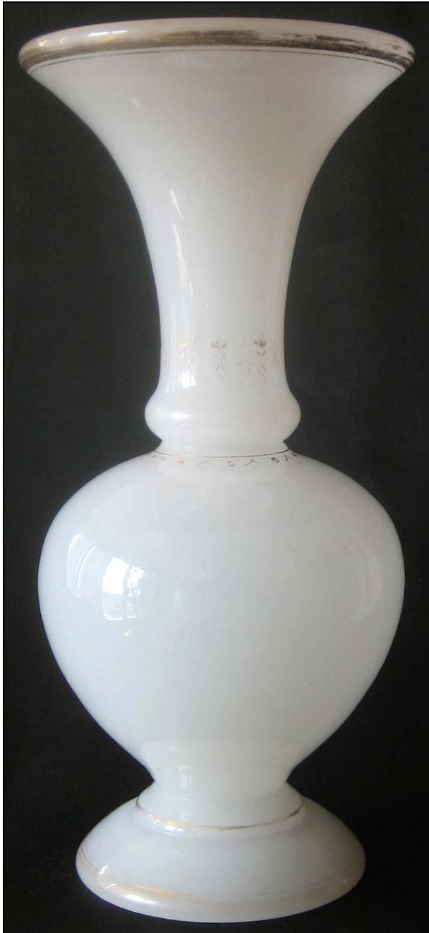
Abb. 2013-4/27-03 Vase mit Resten von Goldbemalung opak-weißes geblasenes Glas, H 24,7 cm, D oben 11,5 cm, D unten 9 cm Sammlung Vogt vgl. Vasen „La Grande Place - Musée du Cristal“ in Saint-Louis

Die opak-weiße , bauchige Vase mit Resten von Goldbemalung wurde in Saint Louis um 1850 hergestellt. Eine in der Form identische grüne Vase befindet sich im „ La Grande Place - Musée du Cristal “ in Saint-Louis , Frankreich. Die Maße der Vase: H 24,7 cm, Durchmesser oben 11,5 cm, Durchmesser unten 9 cm, Gewicht 885 g.