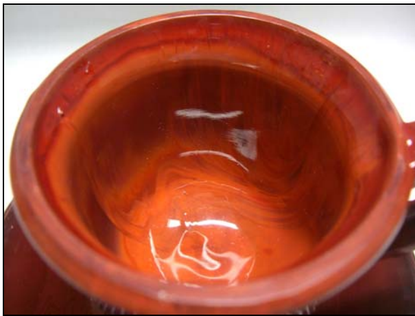
Abb. 2014-1/17-02 Teetasse mit Schale, opak-siegellack-rotes Pressglas, Tasse H 7 cm, D 8 cm, Schale H 3 cm, D 12,7 cm Sammlung Jakob s. MB Launay, Hautin & Cie., um 1840, Planche 31, No. 1484 St.L., Tasse à thé, 1 re grandeur, St. Louis, um 1830

Der Heftnabel ist beschliffen und poliert. Die Tasse wiegt stolze 249 g. Die Untertasse, oder besser gesagt, die Unterschale, ist zugehörig. Die Schale hat einen Durchmesser von 12,7 cm und eine Höhe von 3 cm. Die Unterschale ist nicht aufgeteilt in Spiegel und Fahne, so dass in einem Ring die Obertasse abgestellt werden könnte. Ich meine daher, dass die Bezeichnung als Schale zutreffender ist. Das Musterbuch gibt leider keine Antwort, da nur die Unterseite der Schale abgebildet ist. Das Glas selbst ist der Variante des eher dunkel marmorierten siegellack-rotem Pressglas zuzuschreiben.