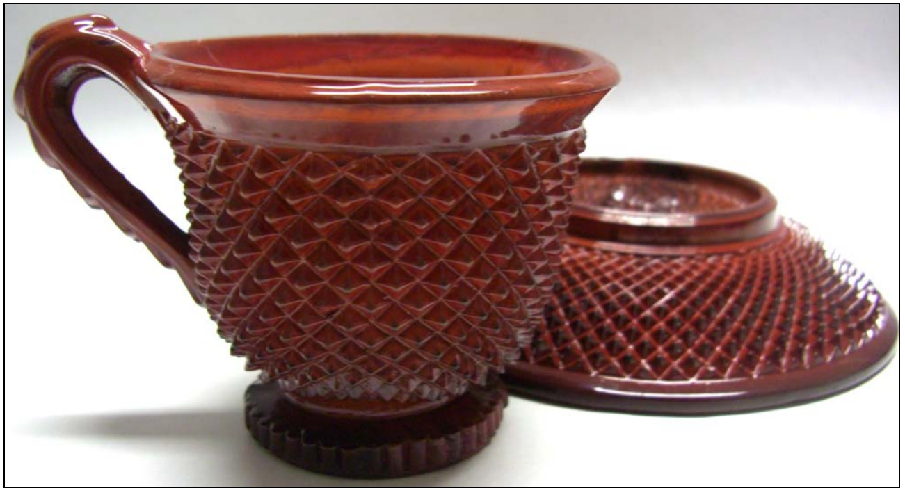
Abb. 2014-1/17-01 (Maßstab ca. 100 %)

Teetasse mit Schale, opak-siegellack-rotes Pressglas, Tasse H 7 cm, D 8 cm, Schale H 3 cm, D 12,7 cm