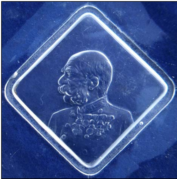
Abb. 2014-1/10-02 (Maßstab ca. 100 %) Quadratischer Teller mit einem Bildnis von Franz Joseph I. von Österreich-Ungarn farbloses Pressglas, mattiert, H 2 cm, D 13 x 13 cm Sammlung Stopfer Hersteller unbekannt, Österreich, Böhmen, Mähren ...? 1900?