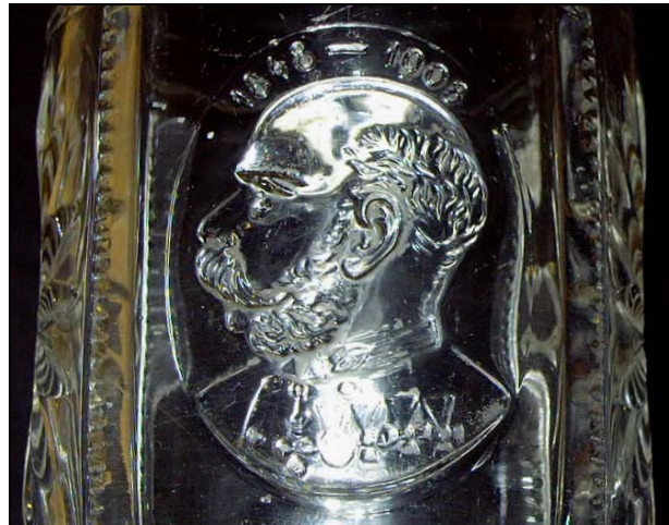
Abb. 2004-4/231 und Abb. 2004-4/230 Krug mit Relief-Portrait von Kaiser Franz Joseph I. von Österreich-Ungarn, 1848-1908 (60-jähriges Jubiläum) farbloses Pressglas, seitlich 2 ovale Sterne, 4 Kantenstäbe mit wagrechten Rillen, H 13,2 cm, D 8,8 cm Sammlung SG PG-808 s. Preis-Kurant Preß-Glas Inwald 1914, Tafel o.Nr. Biergläser mit Quadrat-Boden, Nr. 6683, „mit Kaiserportrait“

Franz Joseph I., Karl I., Napoléon I., Napoléon III., Zar Nikolaus II., Alexander III.