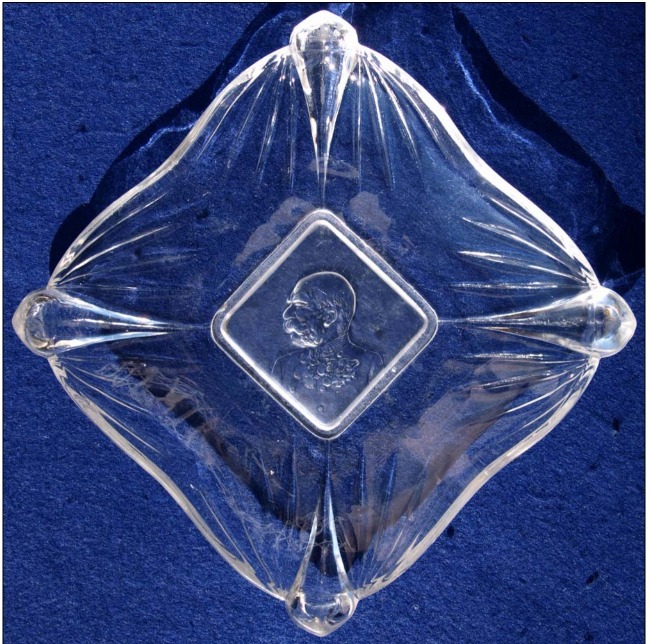
Abb. 2014-1/10-01 (Maßstab ca. 90 %!) Quadratischer Teller mit einem Bildnis von Franz Joseph I. von Österreich-Ungarn, farbloses Pressglas, mattiert, H 2 cm, D 13 x 13 cm Sammlung Stopfer; Hersteller unbekannt, Österreich, Böhmen, Mähren ...? um 1900