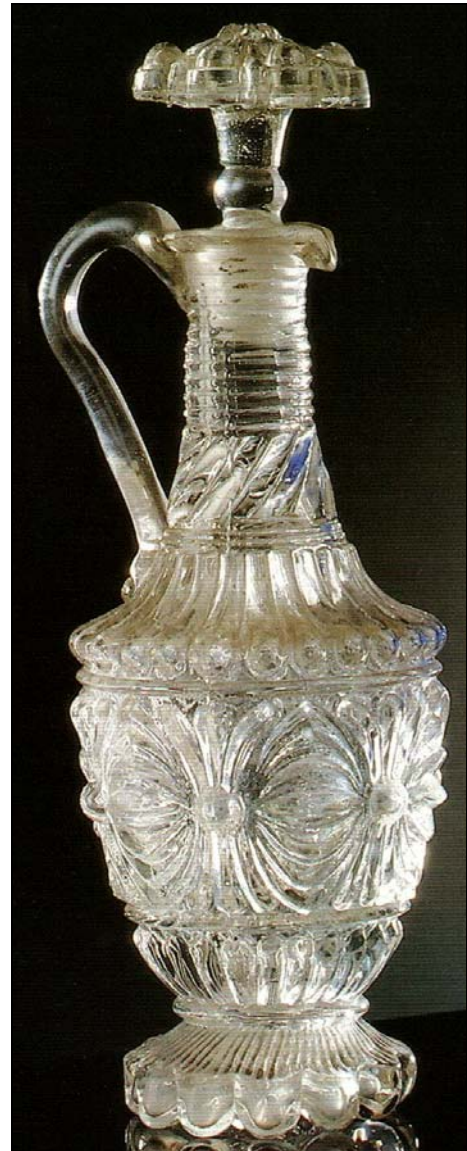
Abb. 2014-2/46-02 (Maßstab ca. 70 %) (PK Abb. 2000-5/197) Karaffe, press-geblasenes Glas, H 21 cm Böhmen oder Mähren, nach 1850 Kunstgewerbemuseum Prag

Zu einer markanten Verbesserung der Qualität und vor allem zu einer Wende im Begreifen der gesellschaftlichen Rolle des Pressglases kam es in den Jahren 1860-1880 , wo sich mit dem Pressen große, modern ausgestattete Glashütten, wie die Glashütte Inwald in Prag-Zlichov , die Riedel'sche Glashütte im Isergebirge [Dolní Polubný / Unterpolauen], der Reich- oder Schreiber-Konzern in Mähren zu befassen begannen. Ihre Produktion orientierten sie auf Gebrauchsglas für Haushalte, Restaurants und Ausschänke.