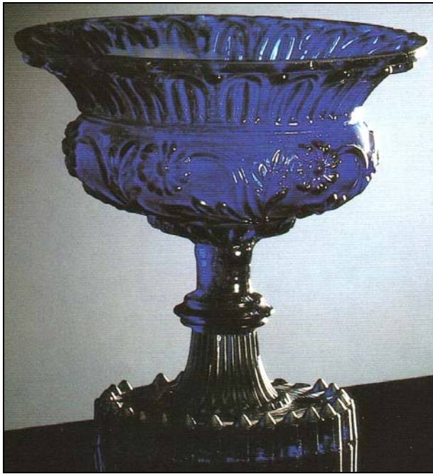
Abb. 2014-2/46-04 Leuchter, uran-farbenes Pressglas, H 21,5 cm Salzschale, uran-farbenes Pressglas, H 8,6 cm Wahrscheinlich Glashütte in Adolfov, um 1850 Kunstgewerbemuseum Prag (vergrößert siehe PK 2014-2-35, Abb. 2014-2/35-03a / 03b)