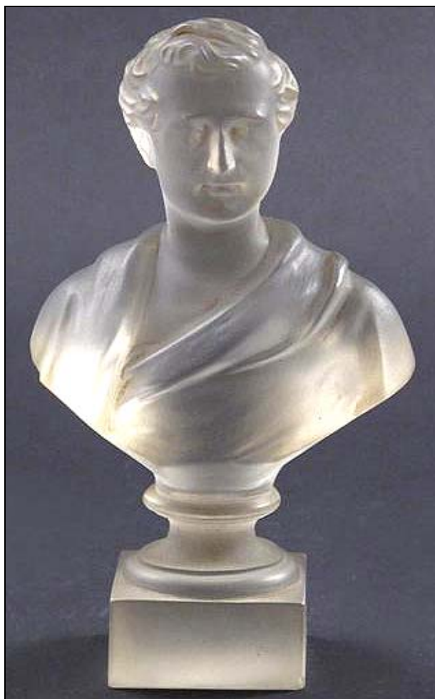
www.the-saleroom.com/en-gb/auction-catalogues/woolley-and-wallis/catalogue-id-2864333/lot-15481850 (Lot 111; 2014-11) A moulded glass portrait bust

Description: A moulded glass portrait bust of Sir Robert Peel , c.1845-51, by F & C Osler of Birmingham , modelled as a Roman emperor, raised on a square socle, moulded mark to the reverse, 17 cm . The same bust on an octagonal plinth is in the Corning Museum of Glass . The Victoria & Albert Museum , London, has the similar bust of Prince Albert that was made for the Great Exhibition of 1851 . Estimate: £ 200 - £ 300