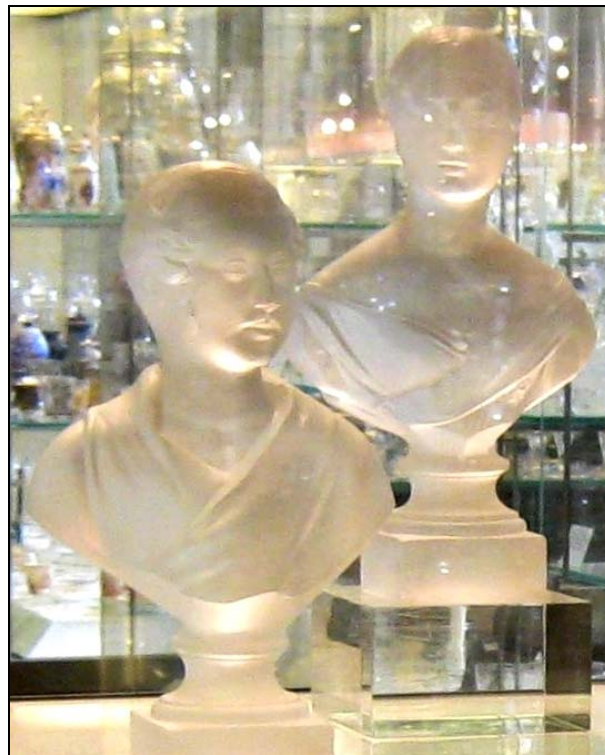
Abb. 2014-4/04 Büsten Prince Albert & Queen Victoria Museum Victoria & Albert, Victorian Britain 19th Century Queen form-geblasenes [mould-blown], mattiertes Glas F. & C. Osler, Birmingham, England 1845