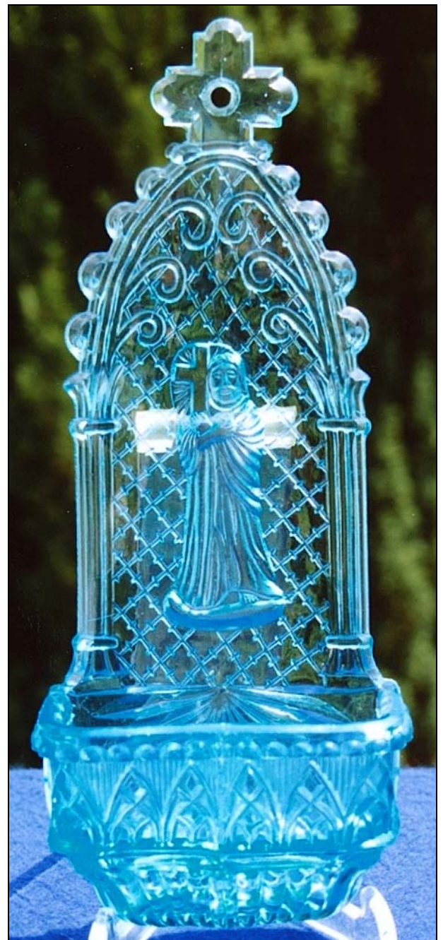
Abb. 2009-3/xxx, s.a. Abb. 1999-6/051 Weihwasserbecken „Christus mit Kreuz“ hellblaues Pressglas, L 19,5 cm Sammlung Stopfer Hersteller unbekannt, um 1900, vgl. Abb. 1999-6/051

Die Paste (miserabel fotografiert), bei der Christus ein kleines Kreuz mit seinem rechten Arm eng umfasst, wurde auch als negatives Relief auf der Rückseite von Weihwasserbecken gefunden, z.B. PK 2009-3 , Stopfer , Gepresste Weihwasserbecken mit abgeschliffenem Ansatz von „Reservoirs“ .