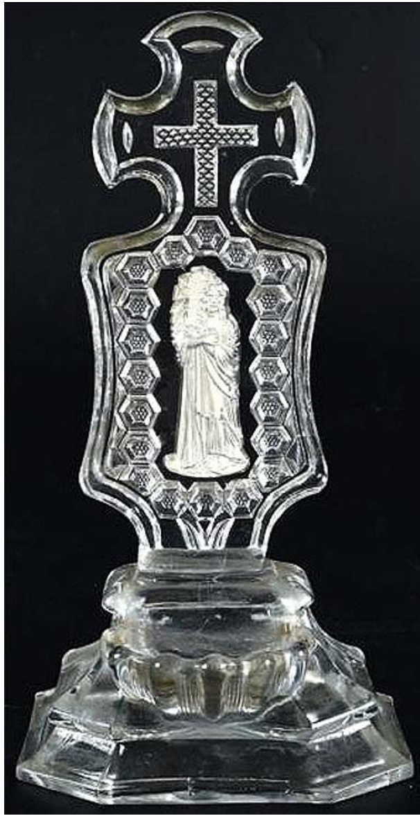
Abb. 2015-2/05-01 (Maßstab ca. 70 %) Postament für Weihwasser mit Kreuz und eingeglaster Paste „Christus am Kreuz“, umrahmt von 6-Ecken farbloses Kristallpressglas, H 21,5 cm

Boisgirard - Antonini / boisgirard.club@ internet.fr