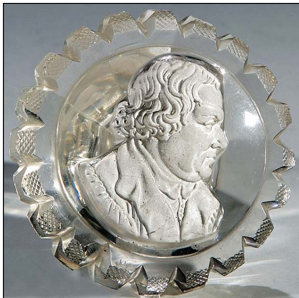
Abb. 2015-2/11-08 Dr. Fischer Auktion Nr. 237, Los 237 Seltener Flakon mit Stöpsel und Pastenbildnis von Martin Luther Gräflich Harrach'sche Glasfabrik, Neuwelt, 2. V. 19. Jhdt. Katalogpreis: 550 - 700 €, Zuschlag 550 €