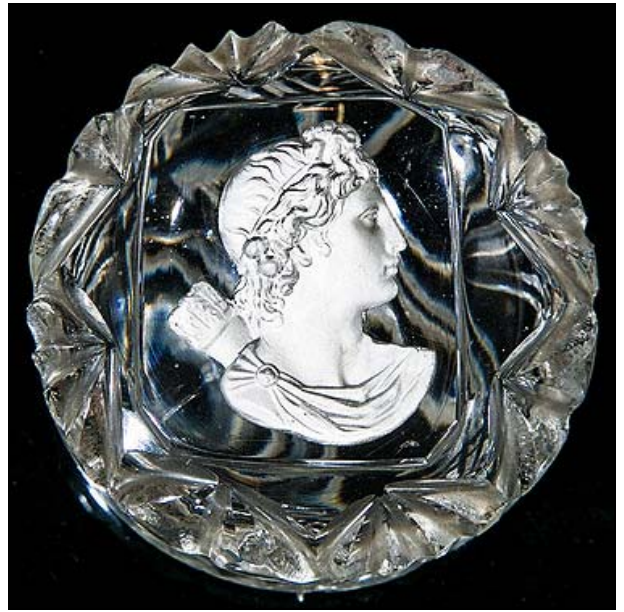
Abb. 2015-2/11-12 Dr. Fischer Auktion 241 II, Los 606 Plakette mit Pastenbildnis Eugene de Beauharnais Farbloses Glas mit eingeglastem Pastenbildnis Eugene de Beauharnais im Profil. D 6,8 cm Eugène-Rose de Beauharnais (1781-1824) war Herzog von Leuchtenberg und Fürst von Eichstätt sowie der Stiefsohn Napoleons I., der ihn später adoptierte. Seit 1805 war er Vizekönig von Italien und heiratete Auguste von Bayern. Frankreich, wohl Baccarat, um 1820 Katalogpreis: 250 - 350 €

Abb. 2015-2/11-11 Dr. Fischer Auktion 241 II, Los 605 Kleine Deckeldose mit Pastenbildnis Apoll von Belvedere Kerbschliffverziertes, metallmontiertes Glas mit eingeglastem Pastenbildnis des Apoll von Belvedere. D 7 cm; H 3,5 cm Frankreich oder Böhmen, um 1820 Katalogpreis: 400 - 600 €