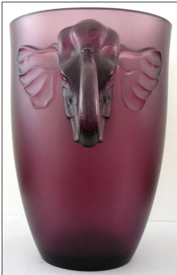
Abb. 2009-2/281 Vase mit Köpfen von Elefanten amethyst-farbenes, satiniertes Pressglas, H 24,7 cm, D 17,5 cm Sammlung Höpp ohne Signatur

s. MB Markhbeinn 1937, Tafel 72, Jardinières ..., Bohême Vasen mit Elefanten-Köpfen, No. 5028, 5029, 5030, 5031, Amethyste platiné, Fumé or, H 250 mm