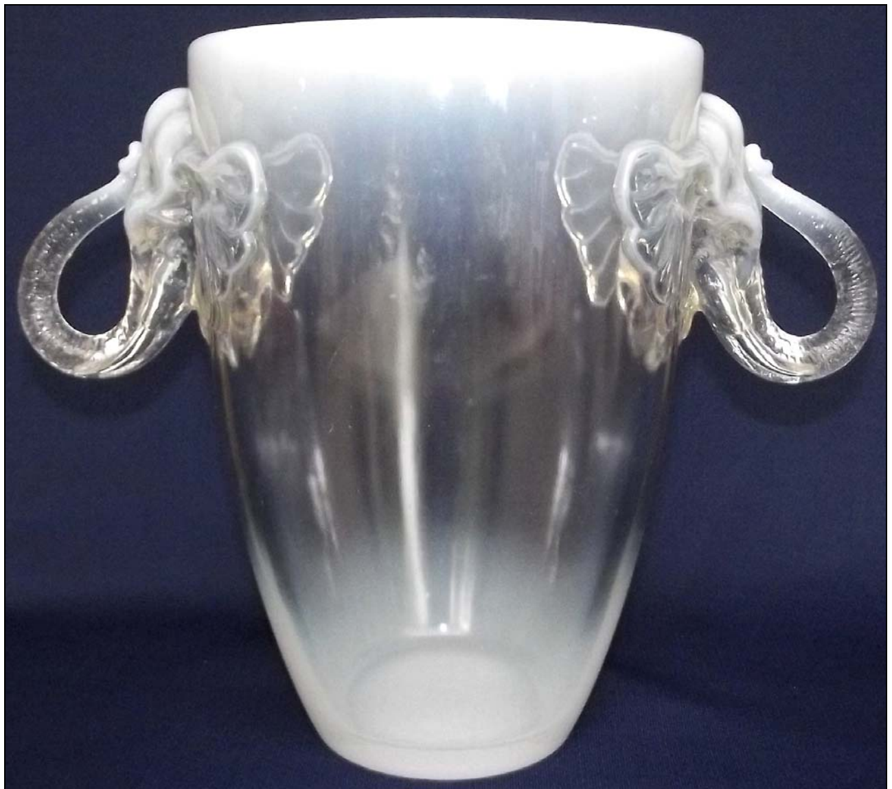
Abb. 2015-2/09-01 Vase mit Köpfen von Elefanten, opalisierendes Pressglas, H 25 cm, D oben 17,5 cm, D unten 10 cm Sammlung Gerlach s. MB Glassexport - Barolac- 1949/1952, Nr. 11630, Rudolfshütte, J. Inwald AG, Teplitz, Tschechoslowakei, vor 1939 s. MB Markhbeinn 1937, Tafel 72, Nr. 5030