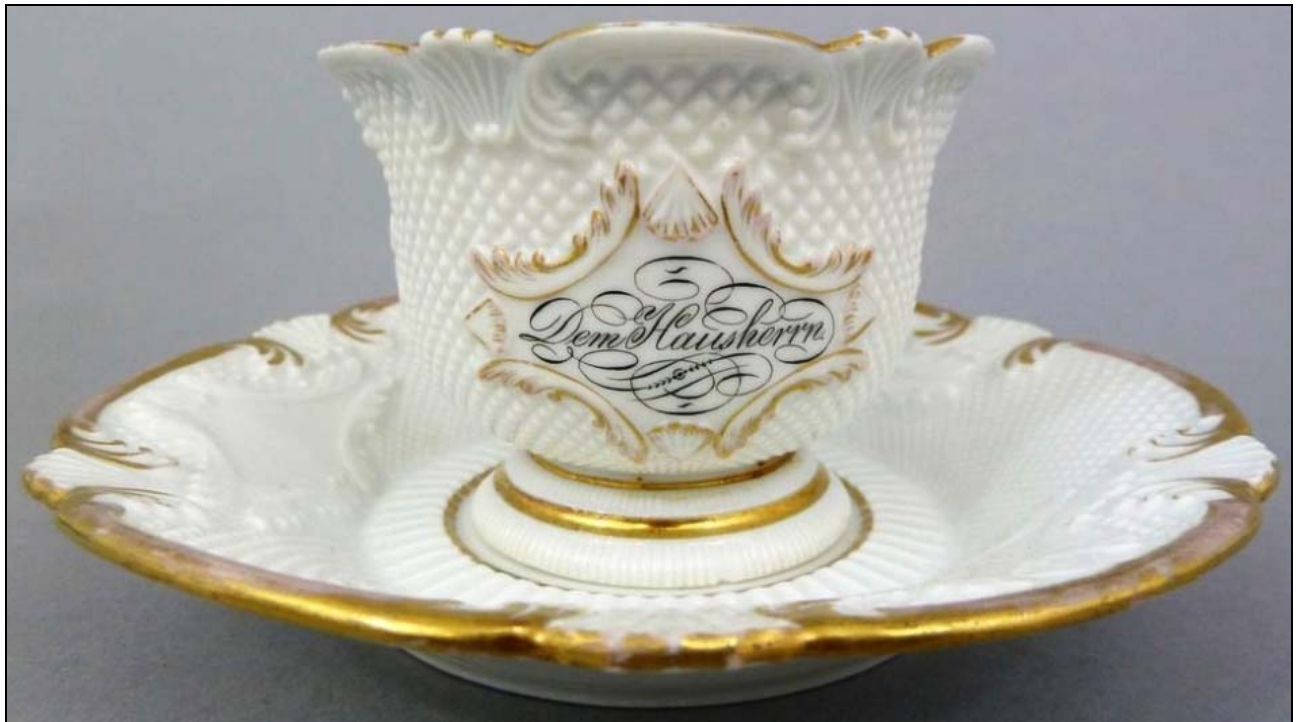
Abb. 2015-3/29-01 (Maßstab ca. 110 %)

Tasse mit Untertasse, Inschrift „Dem Hausherrn“, weißes Porzellan, Muscheln & Diamanten, teilw. glanzvergoldet, Aufschrift schwarz Tasse H ca. 6 cm, D 8,5 cm, Untertasse D ca. 15 cm