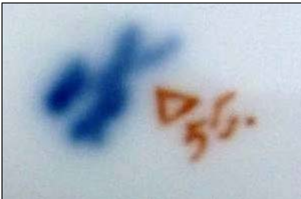
Abb. 2001-05/376 (Ausschnitt)

MB Launay, Hautin & Cie., um 1840, 2. me Partie, Planche 50, Pièces diverses, Salières, No. 1791 S.L., St. Louis, 1840 Tasse à déjeuner M. à Diamants biseaux et Festons