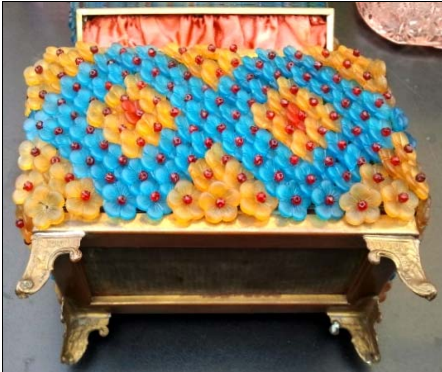
Abb. 2014-4/25-01 (Maßstab ca. 125 %)