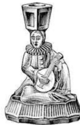
Abb. 2003-3/240 Registriertes Muster Nr. 825109 Musterbezeichnung Walther: Pierrot Artikel-Nummer Walther: 40261, MB 1936, Tafel 115 Tag der Registrierung: 8. Juli 1937 Beschreibung: Kerzenleuchter mit Mandoline spielendem Pierrot

vom 8. Juli bis zum 8. Dezember 1937, obwohl alle Registrierungen das Anmeldungsdatum 22. Dezember 1937 tragen. Dies war unter besonderen Umständen erlaubt, die im Abschnitt 91 des Patents and Design act bestimmt waren.