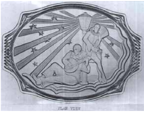
Abb. 2003-3/239 Registriertes Muster Nr. 825108 Musterbezeichnung Walther: Pierrette Artikel-Nummer Walther: 40260, MB 1936, Tafel 71 u. 115 Tag der Registrierung: 8. Juli 1937 Beschreibung: Servierplatte mit Pierrot and Pierrette Anmerkung: diese beiden Clowns stammen aus der italienischen Commedia dell'arte. Pierrot ist ein spaßiger Clown der verzweifelt in Pierrette verliebt ist. Pierrette erwidert nur manchmal seine Zuneigung und Pierrot wird oft abgebildet, wie er allein Mandoline spielt und sich nach Pierrette sehnt. Auf der Platte werden beide zusammen unter einer Lampe dargestellt.

Warum Walther begann, seine Muster im United Kingdom durch Registrierung schützen zu lassen, ist unbekannt. Die registrierten Muster erschienen erstmals im Musterbuch Walther von 1936. Es ist nicht bekannt, ob diese Muster im United Kingdom tatsächlich verkauft wurden, aber die Registrierung gab Walther Schutz vor Nachahmung. Diese Art der Nachahmung gab es tatsächlich. Die Davidson Company war gezwungen, ihre Muster in Australien registrieren zu lassen, nachdem die Japaner mit einer Nachahmung der „Barrel can“ (Reg. No. 802751) begannen und sie auf dem Markt Australiens im Preis unterboten. Walther kopierte selbst Muster anderer Unternehmen. Die Schale „Primus“ ist eine direkte Kopie der Blumenschale 1910BD von Davidson.