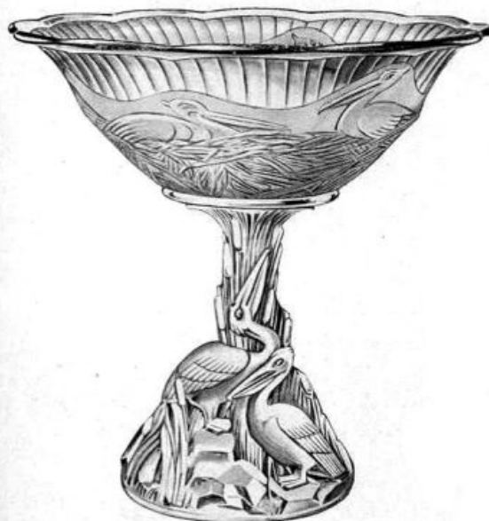
Abb. 2003-3/248 Registriertes Muster Nr. 825123 Musterbezeichnung Walther: Paradies Artikel-Nummer Walther: 46140, MB 1936, Tafel 4 Tag der Registrierung: 1. Dezember 1937 Beschreibung: zwei-teiliger Tafelaufsatz mit Pelikan-Motiv