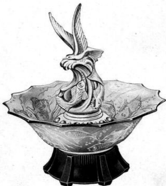
Abb. 2003-3/247 Registriertes Muster Nr. 825118 Musterbezeichnung Walther: Möwen Artikel-Nummer Walther: 40080, MB 1936, Tafel 1 Tag der Registrierung: 8. Oktober 1937 Beschreibung: drei-teiliger Tafelaufsatz mit Ständer, Schale und Figur eines Vogels mit Fischen