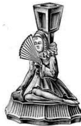
Abb. 2003-3/241 Registriertes Muster Nr. 825110 Musterbezeichnung Walther: Pierrette Artikel-Nummer Walther: 40262, MB 1936, Tafel 115 Tag der Registrierung: 8. Juli 1937 Beschreibung: Kerzenleuchter Pierrette