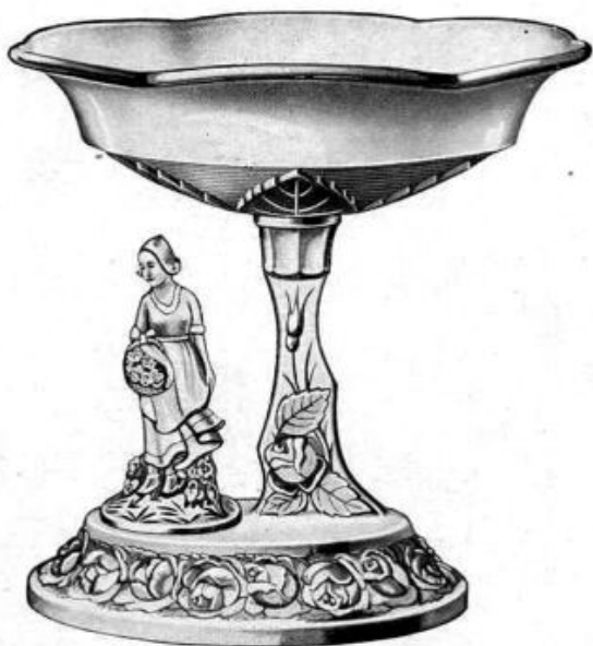
Abb. 2003-3/246 Registriertes Muster Nr. 825117 Musterbezeichnung Walther: Haarlem Artikel-Nummer Walther: 43911, MB 1936, Tafel 2 Tag der Registrierung: 8. Oktober 1937 Beschreibung: drei-teiliger Tafelaufsatz mit Ständer, Schale und Figur einer jungen Frau mit einem Korb Blumen