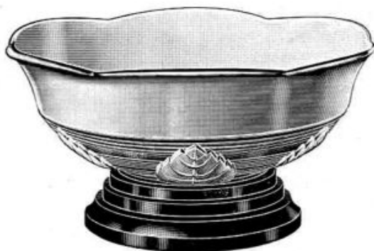
Abb. 2003-3/252 Registriertes Muster Nr. 825128 Musterbezeichnung Walther: Groningen Artikel-Nummer Walther: 40309, MB 1936, Tafel 3 Tag der Registrierung: 8. Dezember 1937 Beschreibung: Schale mit Blätter-Motiv