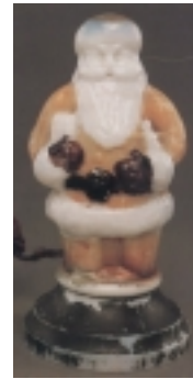
Abb. 06-99/120 Santa Claus als elektrische Lampe aus Chiarenza 1998, S. 107, Abb. 235, in die Form gebla- senes Glas, H 21 cm, Hersteller unbekannt, nach 1900 eher amerikanische Form des Weihnachtsmannes