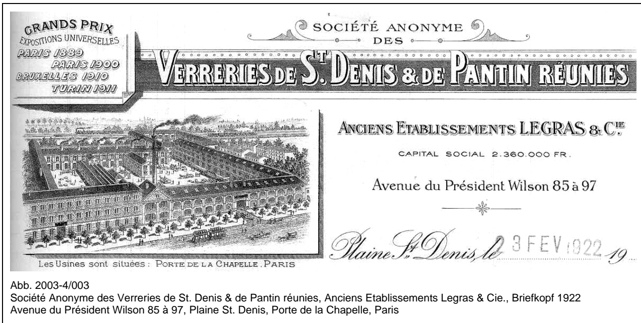
Abb. 2003-4/003 Société Anonyme des Verreries de St. Denis & de Pantin réunies, Anciens Etablissements Legras & Cie., Briefkopf 1922 Avenue du Président Wilson 85 à 97, Plaine St. Denis, Porte de la Chapelle, Paris