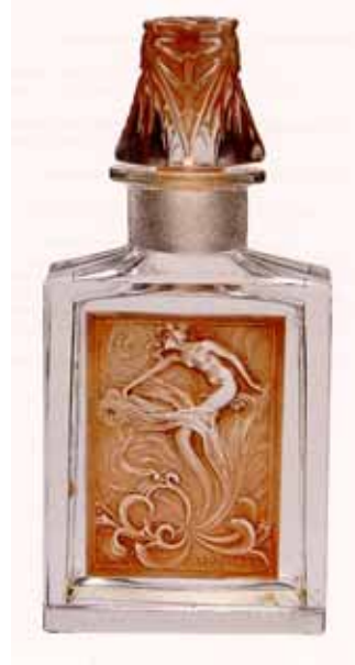
Abb. 2003-4/005 b Flasche mit farbigem Etikett „Eau de Cologne“ farbloses, press-geblasenes Glas Legras & Cie., um 1890, aus Michel 2002, S. 135