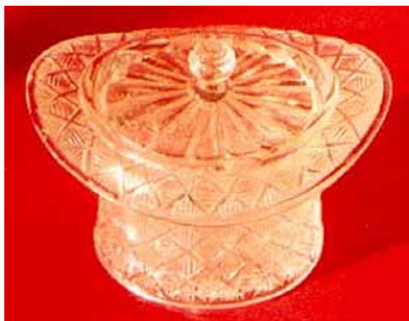
Abb. 2004-2/004 Dose als Zylinderhut, Muster aus schrägen Rauten mit wag- u. senkrechten Rillen, farbloses Pressglas H 6,6 cm, L 11,2 cm, B 9,5 cm Deckel mit Löffelaussparung, nur gering gewölbt, kleiner verzierter Griff, Walzenmuster Sammlung Becker Nr. 4.036 [www.pressglas.de] s. Musterbuch Streit 1913, Tafel 3, Honigdosen, hellweiß, gepreßt, Nr. 1187, „Hutform, hellweiß“, D 10,5 cm“ [Abb. 2001-01/406]

Bei einem Besuch der Website von Arnold Becker [www.pressglas.de] fand ich zufällig zwei Bilder von Zylinder-Dosen und einen bemerkenswerten Hinweis: „Oder, sozusagen umgekehrt, Deckel und Kopfbedeckung für Nr. 1793, Tafel 15. Abb. in weiß opak Chiarenza S. 90, Nr. 187“. Man musste also den Zylinderhut so betrachten, wie er schon in eBay abgebildet war und durfte ihn nicht vom Fuß auf den Kopf stellen! Eine genaue Betrachtung des Bildes bei Chiarenza ergab, dass die Dose „Negerkopf“ tatsächlich einen Zylinderhut mit einem Muster aus schrägen Rauten hat. Jetzt war klar: nicht der Deckel des Zylinders war verloren gegangen, sondern sein Besitzer, der elegante Neger!