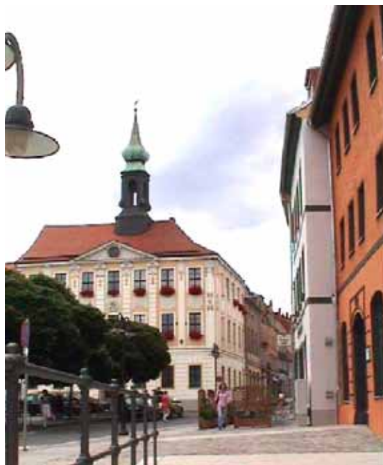
Abb. 2004-2/296 Marktplatz und Rathaus von Radeberg in Sachsen