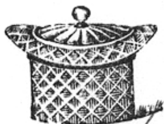
Abb. 2004-2/003 Zylinderhut als Honigdose farbloses Pressglas Musterbuch Streit 1913, Tafel 3, Honigdosen, hellweiß, gepreßt, Nr. 1187, „Hutform, hellweiß, D 10,5 cm“ Abb. 2001-01/406

Der neu erworbene Zylinder ist aus leicht rosa-farbenem Pressglas, 6,8 cm hoch, an der Krempe 11,2 cm lang und 9,2 cm breit. Damit stimmt er nicht mit dem Maß im Streit 1913, Tafel 3, Honigdosen, hellweiß, gepreßt, Nr. 1187, „Hutform, hellweiß, D 10,5 cm“ und auch nicht mit den dort angegebenen Farben überein. Ich war aber sicher, dass es sich um das entsprechende Pressglas handelt. In der Krempe des Zylinders gibt es einen Falz für einen Deckel, der verloren gegangen ist.