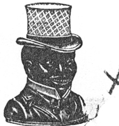
Abb. 2004-2/008 Neger mit Zylinderhut Zylinder m. Muster aus schrägen Rauten mit wag- u. senkrechten Rillen Musterbuch Streit 1913, Tafel 15, Versch. Dosen, gepreßt, Nr. 1793, „Negerkopf“, B 15,0 cm, hellweiß, milchweiß und türkisblau, milchweiß bemalt (wann der Artikel „milchweiß und türkisblau“ gestrichen wurde, ist unbekannt)

Nr. 1793 Negerkopf Breite 150 mm hellweiß Preis per 100 Stück M. 65.-- milchweiß und türkisblau Preis per 100 Stück M. 75.-- milchweiß bemalt Preis per 100 Stück M. 95.--