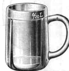
Deutsch-Pilsner Seidel, niedrig, mit Mundrand