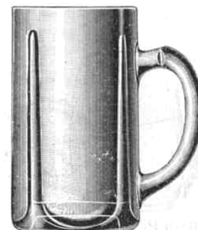
Deutsch-Pilsner Seidel, niedrig, gewöhnlich (Vierkantseidel)