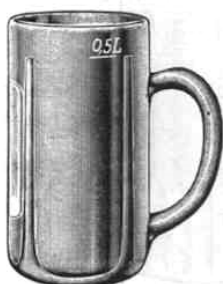
Deutsch-Pilsner Seidel, niedrig, mit Schild