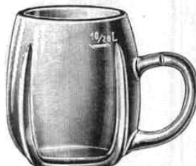
Deutsch-Pilsner Seidel, niedrig, bauchig