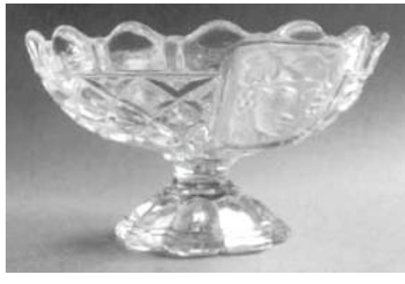
Abb. 2003-3/xxx Fußschale m. 2 Masken und Rauten farbloses Pressglas, teilw. mattiert, H 10 cm, D 17,5 cm ohne Marke, Hersteller unbekannt entweder Baccarat oder S. Reich & Co. 1880 vgl. MB Reich 1880, Tafel A, Nr. 1710

„Form und Dekor: Auf 8-passigem gewölbtem Fuß kurzer 8-eckiger Schaft. Ausladende Kupa, dreifach unterteilt: über einem Rippensegment Rautenfries. Darüber breiter Rand aus Rundbögen unterbrochen durch Stege. Einander gegenüber liegend zwei mattierte Schildmedaillons mit je einem Frauenkopf in Hochrelief umgeben von Pflanzenornamenten.“ [www.pressglas.de/Sammlung/fussschalen_einfu/F/-Fussschalen_4_/fussschalen_4_.html]