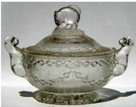
Abb. 2002-5/139 Deckeldose mit Katze und zwei Hunden als Griff farbloses Pressglas, Dose H 8,2 cm, D 11,9 / 16,5 cm Sammlung Geiselberger PG-287 s. Preis-Kurant Preß-Glas Inwald 1914, Zucker- und Butterdosen, Nr. 5714

SG: Im Milk Glass Book von Chiarenza 1998, Abb. 337, fand ich den ersten Hinweis auf Davidson. Die Hunde sehen wie Löwen aus!