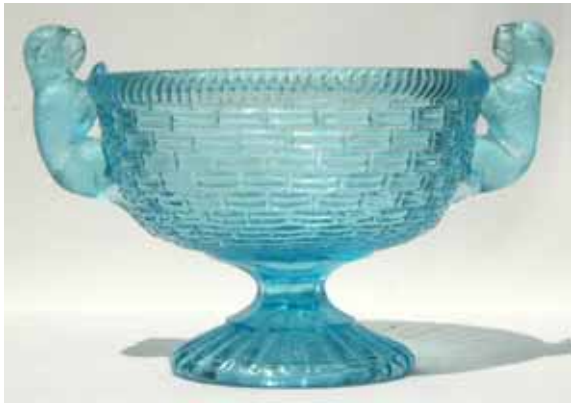
Abb. 2003-4/300 Deckeldose mit zwei Hunden als Griff (Deckel fehlt) Flecht-Muster, Schnur-Rand, Boden unten m. konz. Rillen hellblaues Pressglas, Dose H 9,5 cm, D 12,4 / 16,4 cm Sammlung Geiselberger PG-718 vgl. Preis-Kurant Preß-Glas Inwald 1914, Zucker- und Butterdosen, Nr. 5712 vgl. Chiarenza 1998, S. 144, Nr. 337, Dose mit Katze und Hunden, opak-kalk-weißes Glas vgl. Davidson, Musterbuch um 1885, Dose Nr. 26

Auch im „Preis-Kurant Preß-Glas“ Josef Inwald, Wien - Teplitz, von 1914 [PK 2002-4, Anhang] wurden Bilder dieser Dose mit einer Variante gefunden. Die drei Deckeldosen meiner Sammlung aus farblosem Glas mit teilweiser Vergoldung hatte ich von Anfang an einem Hersteller aus Böhmen zugeordnet. Sie stammen sicher von Inwald und nicht von Davidson: mit ihrer Vergoldung sind sie typisch für Pressglas aus Böhmen. Sicher ist jedenfalls, dass die Deckeldose von Davidson um 1900 auch von Inwald in Böhmen hergestellt wurde.