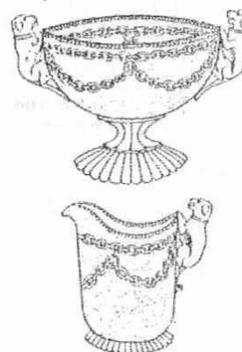
Abb. 2002-5/136 Deckeldose Nr. 26 mit Katze und zwei Hunden als Griff Milchkännchen Nr. 26 mit Katze als Henkel Musterbuch eines englischen Großhändlers, um 1885 aus Crowshaw, Davidson 1878-1888