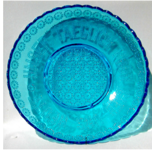
Abb. 2002-4/144 (wie Abb. 2000-3/153, Sammlung Billek) Brotteller m. Rosetten, punktierte Aufschrift „UNSER TAEGLICH BROD GIEB UNS HEUTE“ Slg. Geiselb. PG-640, hellblaues Glas, H 4,5 cm, D 23 cm Hersteller unbekannt, Österreich / Böhmen vermutl. Glaswerk Karolinka, S. Reich, Mähren, um 1890

Zum blauen Teller „Brod“ habe ich seitdem in eBay ein Gegenstück erwerben können, das aus farblosem Glas ist und bei dem der Spruch „UNSER TAEGLICH BROT GIB UNS HEUTE“ entsprechend der Reform der Rechtschreibung 1901 modernisiert ist. Sonst entspricht der neue Teller völlig dem blauen Teller Abb. 2002-4/144.