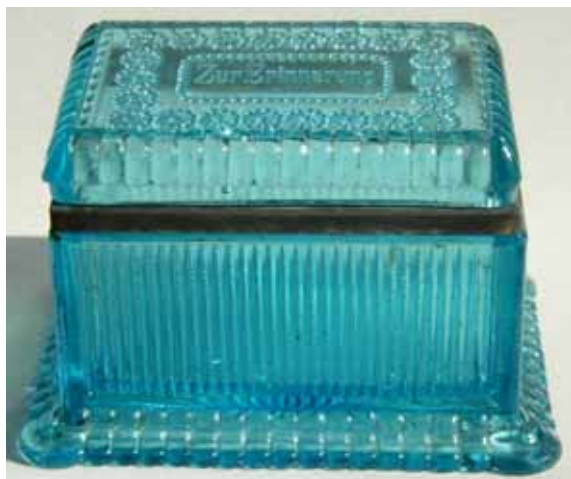
Abb. 2003-4/330 Zuckerkoffer mit senkrechten Rillen und Walzen Metall-Montierung (teilw. verloren) Deckel mit Rosetten und Perlen eingepresste Inschrift „Zur Erinnerung“ blaues Pressglas, H 6,4 + 1,8 cm, L 12,6 cm, B / 9,4 cm Sammlung Geiselberger PG-728 vgl. MB Streit 1913, Tafel 57, Zucker-, Tee- und Schmuck- kästchen, „Luise“, Nr. 94 und 95