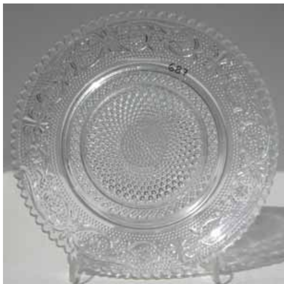
Abb. 2003-3/177 Teller mit Ranken, Sternen und Diamanten farbloses Glas, H 1,9 cm, D 14,8 cm Sammlung Geiselberger PG-687 eingepresste Marke KIG MALAYSIA auf der Oberseite Hersteller unbekannt

Die eingepresste Bezeichnung befindet sich auf der Gebrauchseite des Tellers und verschwindet in dem eingepressten Muster mit Bögen aus Diamanten. Die eingepresste Marke auf der Oberseite des Glases konnte ich nicht fotografieren.