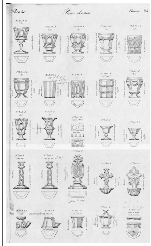
Abb. 04-99/31 aus Franke 1990, Abb. 47, Musterbuch Launay Hautin & Cie., Ausgabe ab 1842, 2. ieme Partie, Planche 94, „Pièces diverses“

Beim zuerst im Tarif vom September 1836 erwähnten Service mit Girlandendekor (Tafel 52) war dann im Tarif bei den Services kein Platz mehr frei, sodass jetzt in dem Tarif eine neue Seite (Seite 17) eingefügt wurde. Im Tarif vom Mai 1836 war dieses Service noch nicht vorhanden. Es ist also nicht abwegig, anzunehmen, dass nicht nur die beiden Service von den Tafeln 6 und 7 zum Erscheinungspunkt des frühesten Tarifs bereits aus dem Angebot genommen worden waren, sondern sogar noch zwei weitere.