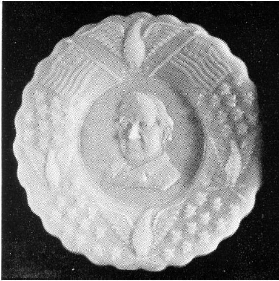
Abb. 04-99/191 aus Belknap 1949, S. 10, Abb. 6 c, „Bryan Plate“, Teller mit geprägten Flaggen, Sternen und Adlern auf der Fahne und geprägter Abbildung im Fond, D 7 Zoll, ohne Hersteller und Zeit, vermutlich Westmoreland vor 1900

Eine Abbildung des Tellers ohne geprägte Abbildung im Fond und mit anscheinend verlaufenen Sternen in der Flagge findet sich auf S. 277, Abb. 251 a: „Fleur de Lis, Flag and Eagles“, D 7 Zoll und auf S. 289, 3. Reihe, linker Teller, Belknap bezeichnet die weiß-opaken Stücke, die zusammen in einer Vitrine aufgestellt sind, als „China Cabinet of Westmoreland Reproductions.“ [SG: mit „China“ wird weißes Porzellan bezeichnet, der Ausdruck wird von Belknap auf weiß-opakes Pressglas übertragen, das oft als Ersatz für Porzellan hergestellt wurde, s. Neuwirth 1993]