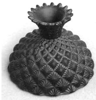
Abb. 2002-1/177 Dose m. Deckel, Blüten-Dekor, opak-schwarzes Pressglas (Hyalith), H 6,1 cm, B 9,1 cm, L 14,6 cm russische Inschrift u. 1914 aus Sellner 1986, Kat.Nr. 193 u. Abb. Anlage Nr. 50 Sammlung Lobmeyr Wien