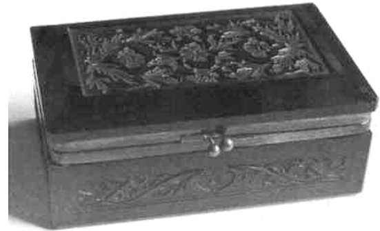
Abb. 2002-1/178 Dose m. Deckel, Blüten-Dekor, opak-schwarzes Pressglas (Hyalith), H 6,1 cm, B 9,1 cm, L 14,6 cm russische Inschrift u. 1914 aus Sellner 1986, Kat.Nr. 193 u. Abb. Anlage Nr. 50 Sammlung Lobmeyr Wien

Es ist sehr wahrscheinlich, dass alle Gläser von dem selben, bisher unbekanntem Hersteller stammen. Nun wäre natürlich interessant zu wissen, woher diese Gläser wirklich kommen!