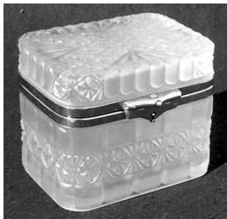
Abb. 2002-1/174 Zuckerkoffer m. Pseudoschliff, farbloses, mattiertes Press- glas, L 12 cm, B 8,7 cm, H 9,9 cm Unterseite m. Rundmarke u. russischer Inschrift u. 1903 Sammlung Stopfer, ähnlich Spillman 1981, Abb. Nr. 1533