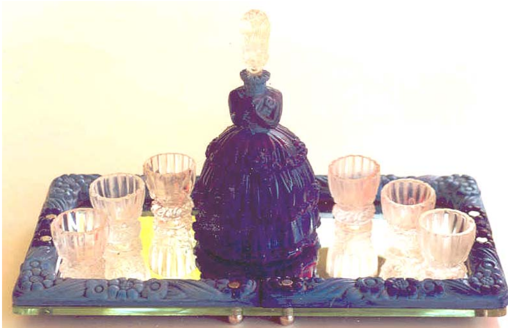
Abb. 2002-1/179 Likör-Service mit Rokoko-Dame, 6 Gläser u. Tablett als Spiegel opak-blau marmoriertes u. farbloses Pressglas, Karaffe H 11,5 cm, D 8,5 cm, Stöpsel H 3,5 cm, Tablett B 14,8 cm, L 29,5 cm Sammlung Breit, Schwäbisch-Gmünd