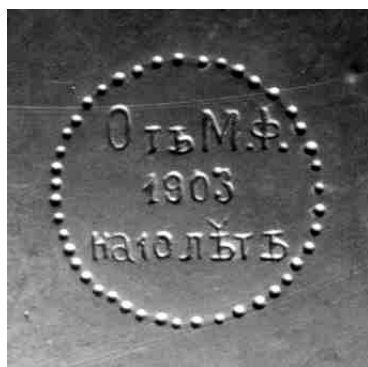
Abb. 2002-1/174 Zuckerkoffer m. Pseudoschliff, farbloses, mattiertes Press- glas, L 12 cm, B 8,7 cm, H 9,9 cm Unterseite m. Rundmarke u. russischer Inschrift u. 1903 Sammlung Stopfer, ähnlich Spillman 1981, Abb. Nr. 1533