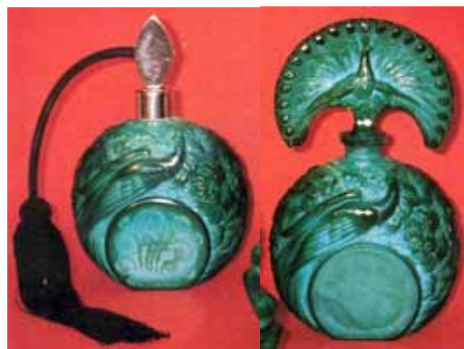
Abb. 2002-4/329 Parfüm-Flakons u. Puderdose „Peacock“ [4] aus einem Musterbuch „Ingrid designs“, S. 23, Nr. 30329 aus Sims 1996, S. 97, Abb. 4, Sammlung Sims