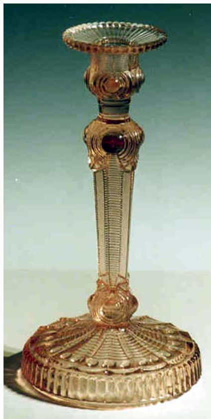
Abb. 2002-1/024 Leuchter aus Bayel / Fains rosa Glas, auch blau und farblos gesehen H 21,7 cm, D Fuß 10,9 cm 4 Formnähte, verlaufen unauffällig im Vierkant-Stiel Sammlung Billek Musterbuch Bayel 1923, Pl. 64, S. 145, „Flambeaux“ 1. Reihe, 1. von rechts, Nr. BY 3025

Diese Notiz soll die Leser der Pressglas-Korrespondenz auffordern, die Augen offen zu halten und vor jedem Kauf sorgfältig zu prüfen, ob ein vermeintlich älteres oder altes Stück, das man aus einem Musterbuch wieder erkennt, auch mit der Glasqualität „stimmt“. Selbstverständlich wurden die Leuchter in dem Geschenkeladen nicht als alt bezeichnet und der Preis war niedrig. Aber mit einem solchen Angebot ist ja nicht auszuschließen, dass solche Leuchter irgendwann auf Flohmärkten auftauchen and als alt angepriesen werden.